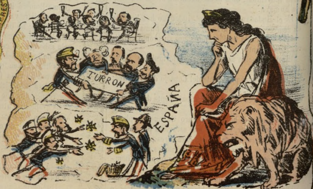
LA NATIVIDAD DE LA VIRGEN.

Renace la libertad Y al emprender su campaña ¡Dale la misma zizaña! ¡La misma bestialidad!