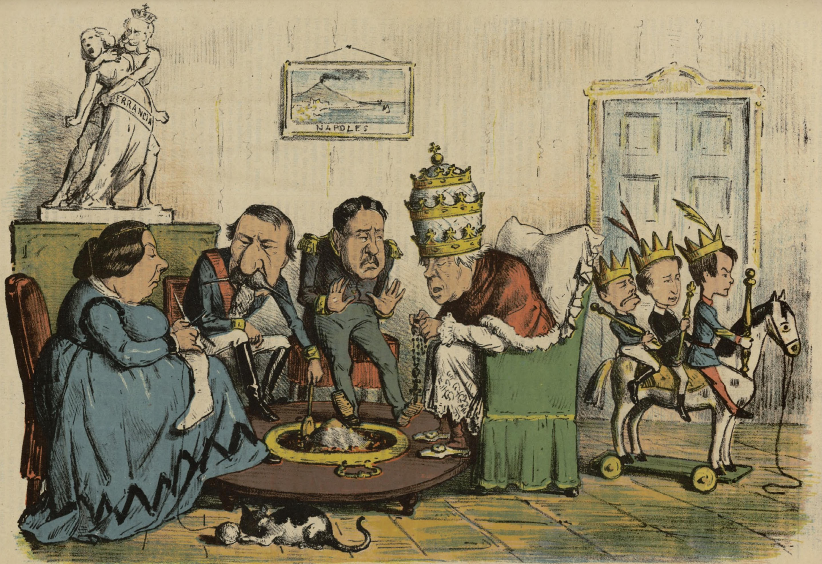
6 DE ENERO: LOS REYES. Ayuntamiento de Madrid