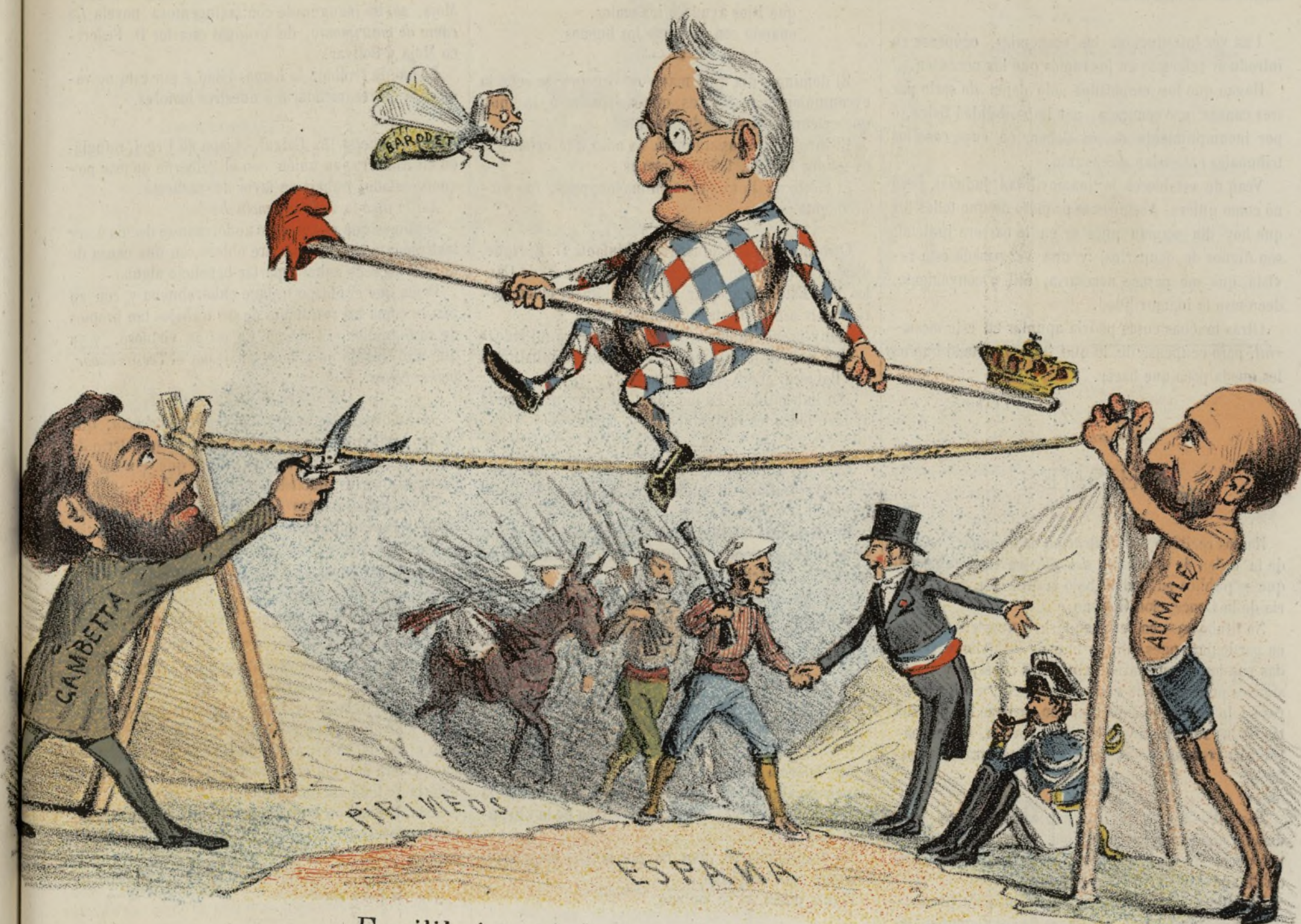
Equilibrios, trampas y peligros.