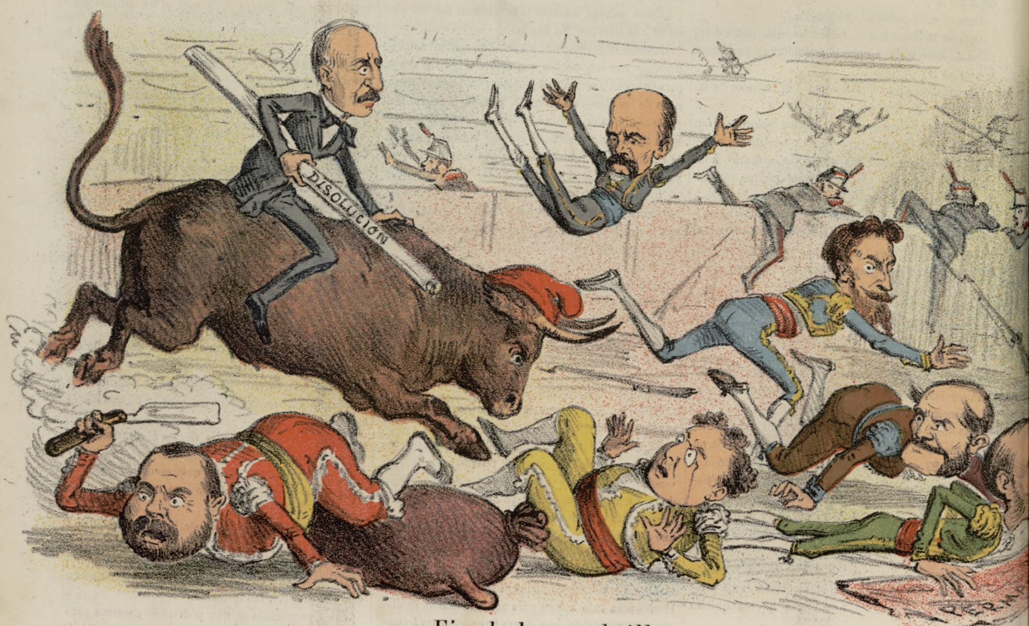
Fin de la cuadrilla.