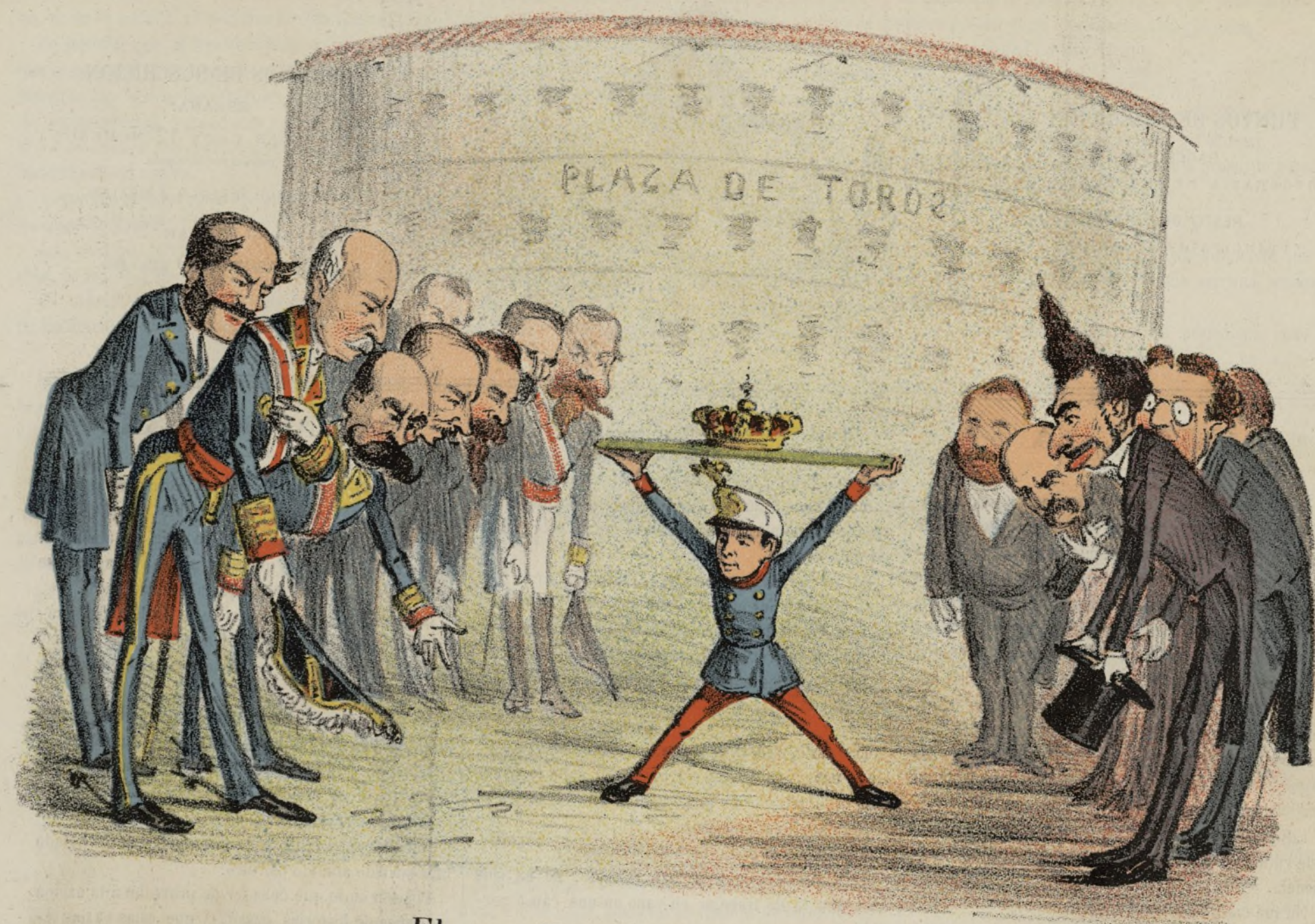
El rey X y sus adoradores.