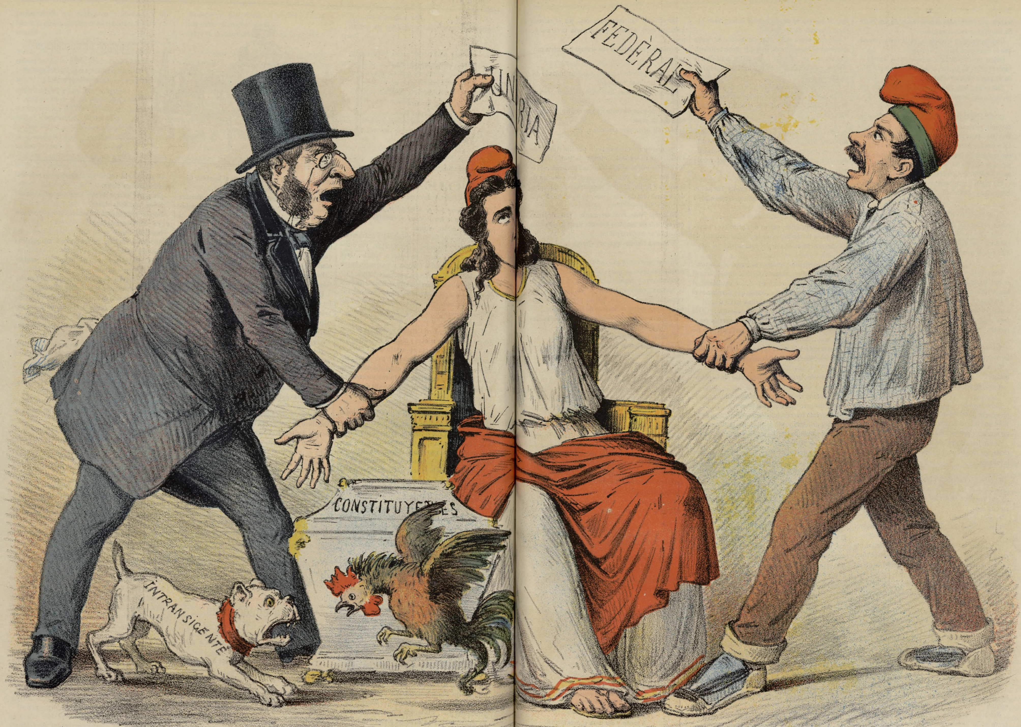
¿CUAL SERÁ? Ayuntamiento de Madrid