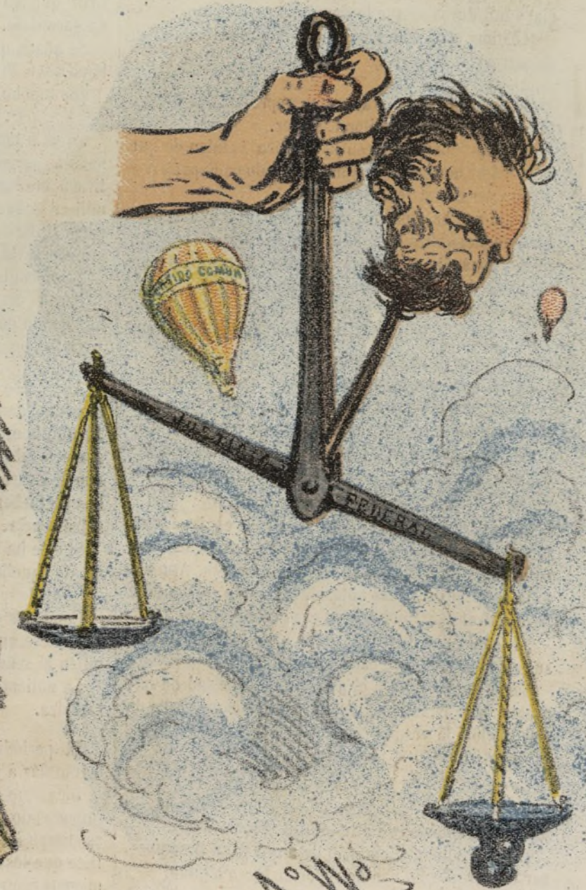
Ni Rey ni Roque.