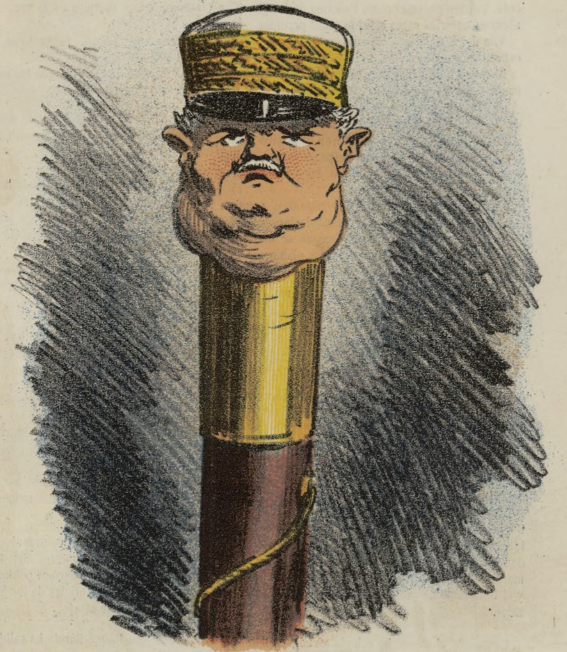
Un General que siendo CONTERA pretende ser puño.