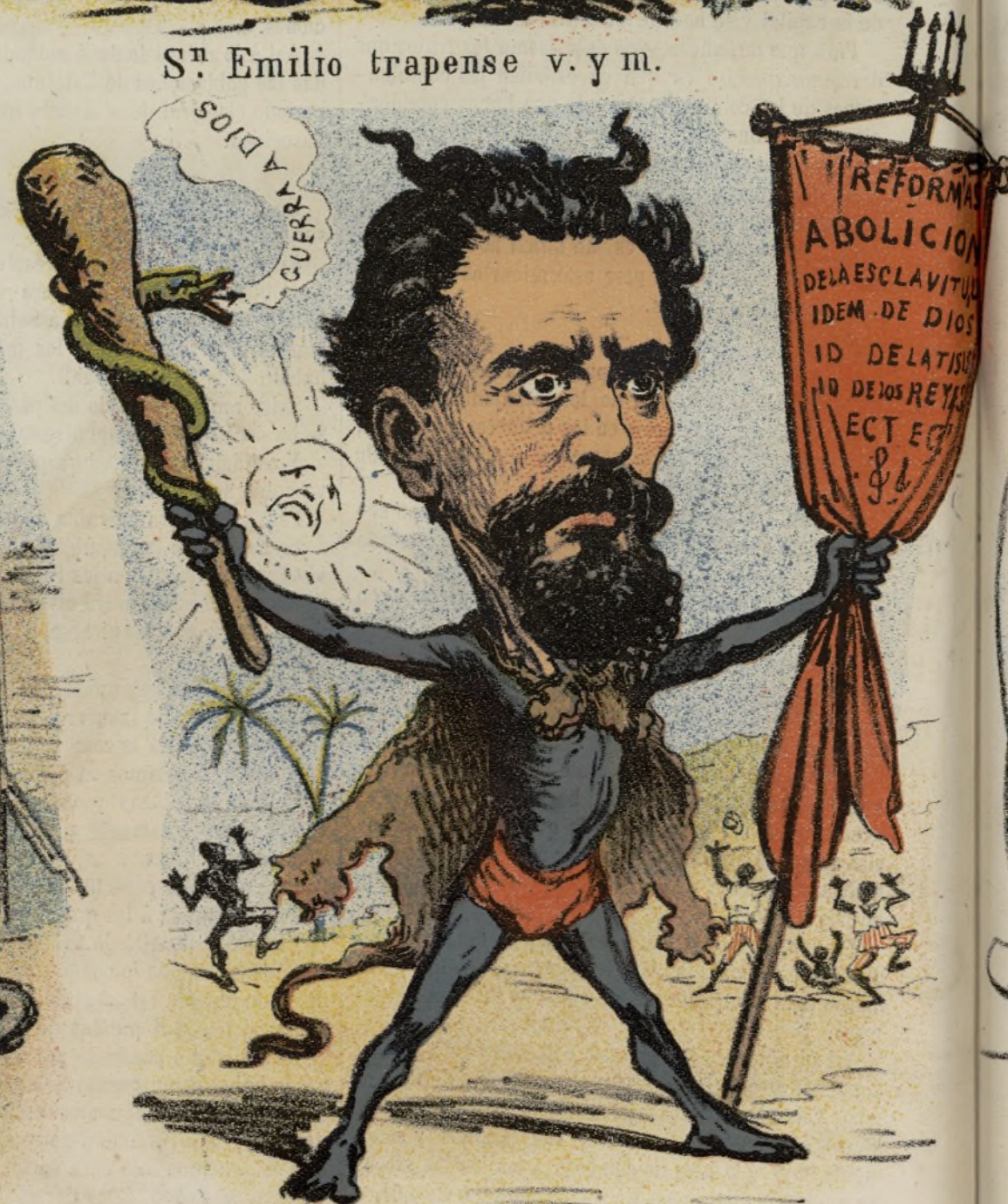
De Dios abajo ninguno y politico mas osado El MINISTRO DE ULTRAMAR.