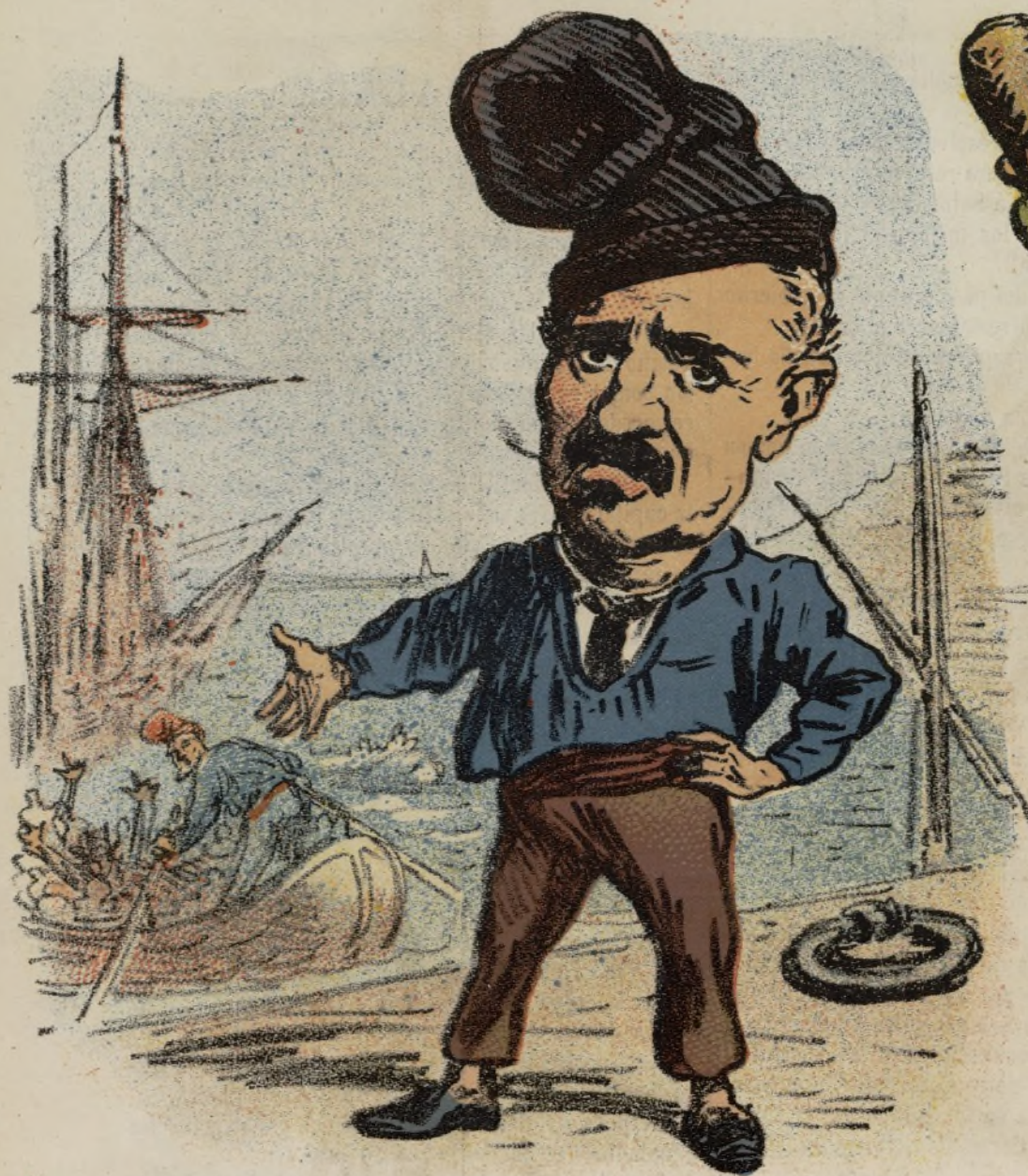
El patron araña.