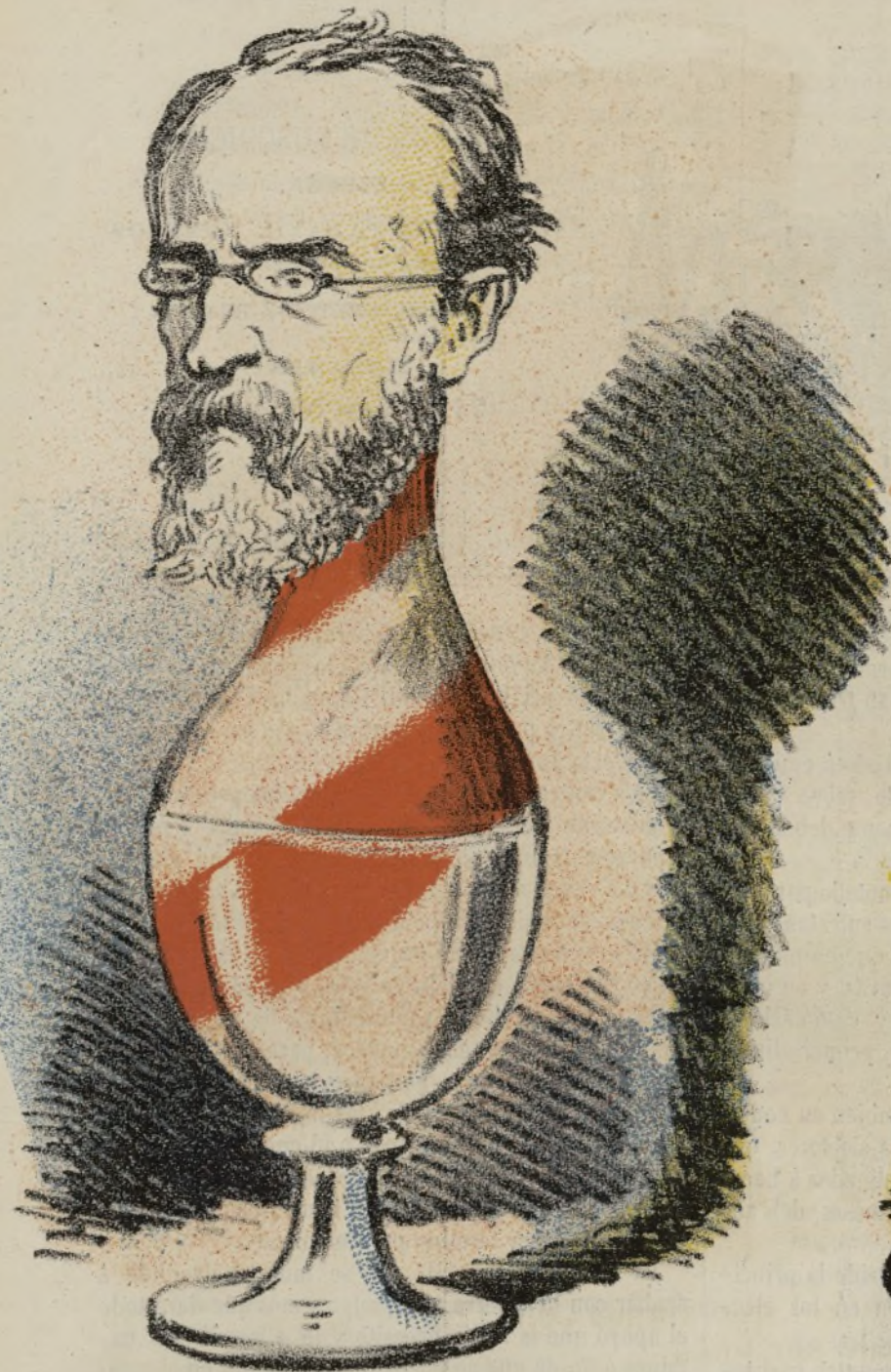
El hombre de hielo.