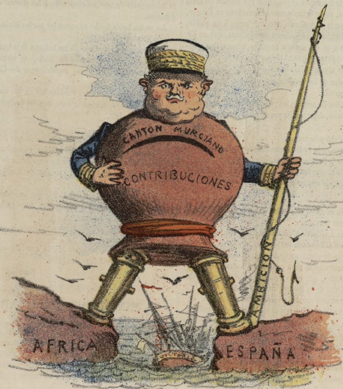
Amar revuelto, ganancia de cantoneros.