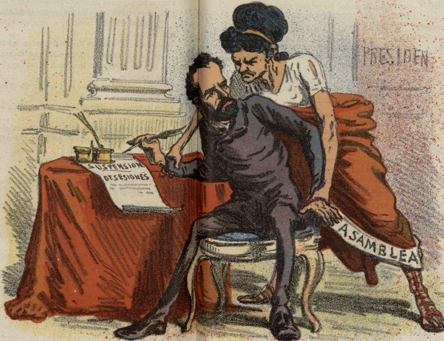
La asamblea hace con el gobierno lo que el perro del hortelano Ni come las berzas, ni las deja comer.