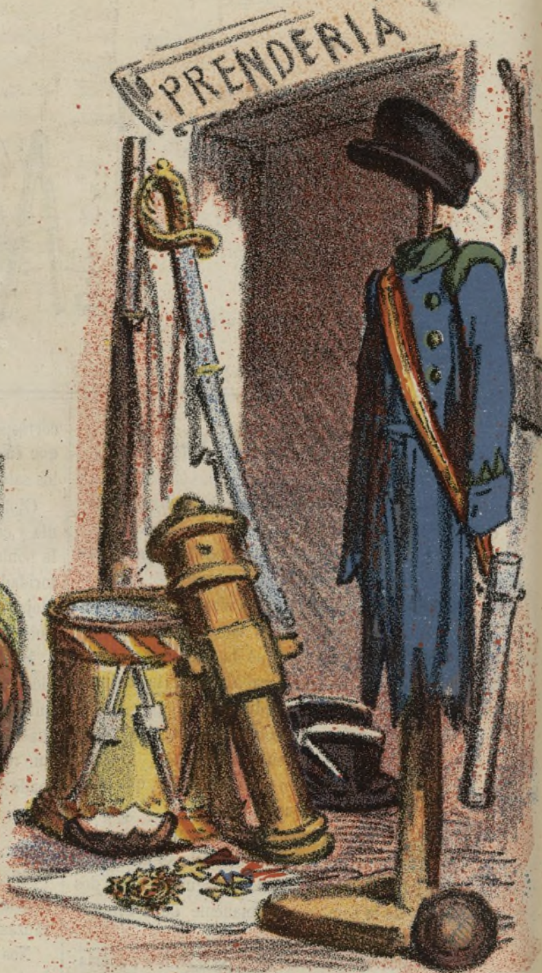
Estado actual del ejército.