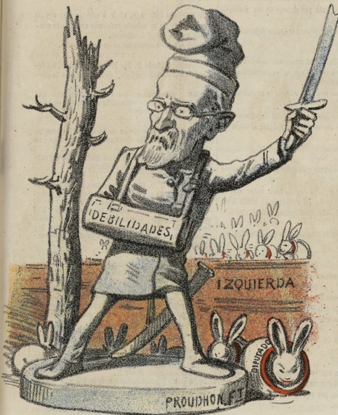
El campeón de la izquierda (estatua en yeso.)