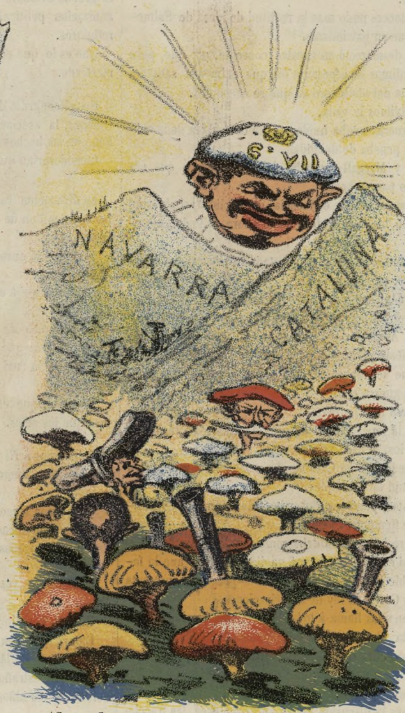
Abundante cosecha se nos prepara.