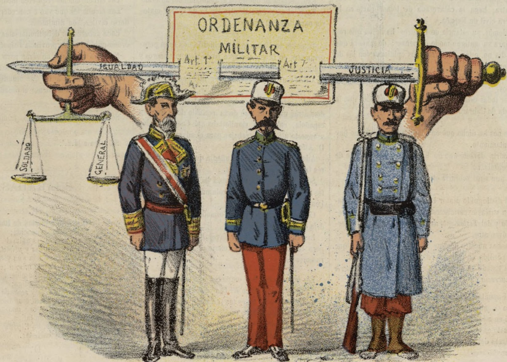
Sea igual para todos.