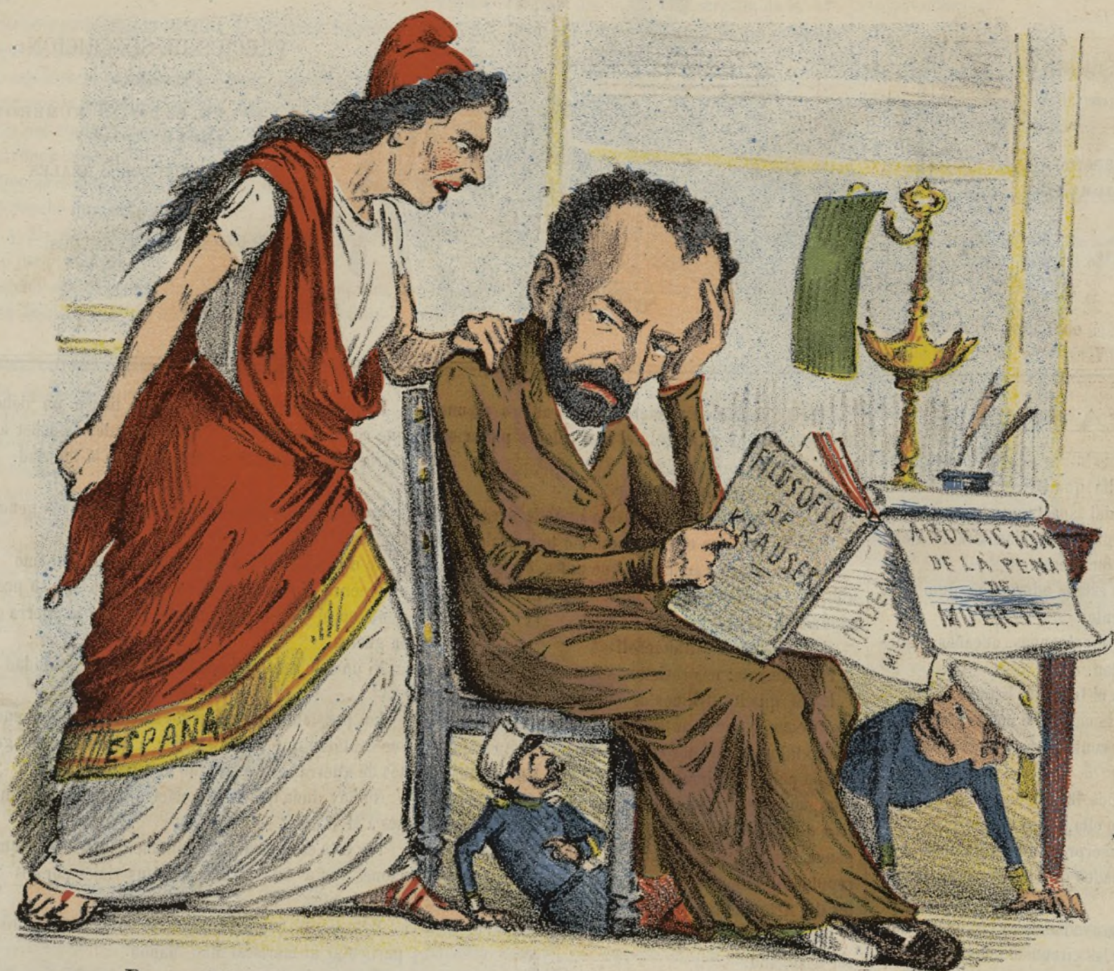
¡¡¡ Para filosofías estábamos !!! y se nos quema la casa.