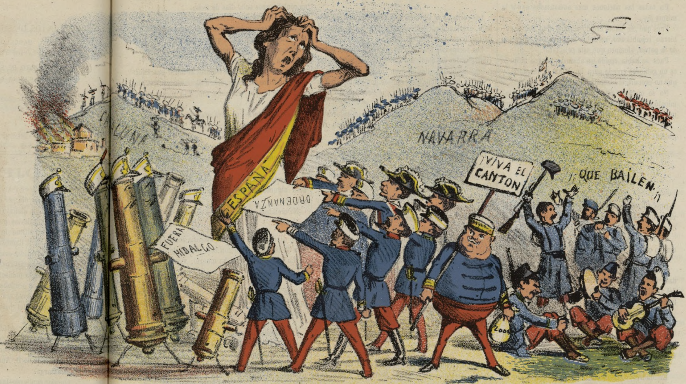
Varios problemas de difícil solución.