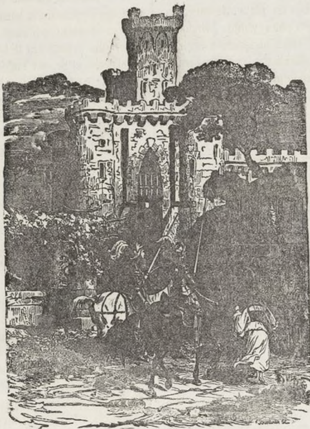
El Castillo de Tudela.

to cuerpo, y con el blanco cendal que en la mano tenia, hubo de acudir á sus hermosos ojos, humedecidos con dulces lágrimas.— ¡Ea! dijo Fruela-Ramirez al entrar en el salon: abrázame, miquerida Adosinda, y dispon se agasaje cumplidamente á este valiente extranjero, que acaba de liberarme de las garras del oso mas feroz que se crió en nuestros montes.— Por la Virgen de las batallas, que es de brazo y brio este jóven cazador.—Él