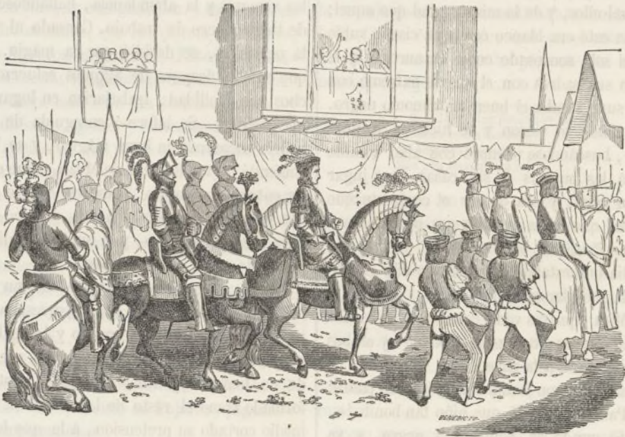
Una embajada en la edad media.

Pero apenas habian comenzado, entraron dos hombres que venian de Colonia y traian una carta al dean. Era que su tío el obispo ha-