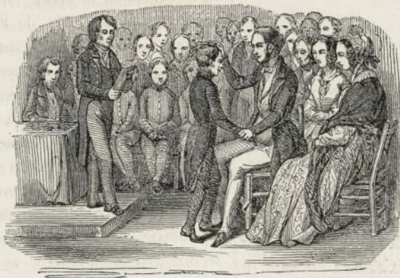
La corona de oro.

Raoul, que habia alcanzado el último accé-