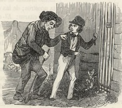
El anciano y el niño.

¡Honor y respeto al anciano que sabe llenar su misión santa sobre la tierra: bendición y amor al niño, á quien Dios concede sensibilidad para llenar la suya. Cuando les falta virtud para cumplirla, compadecedlos: no merecen el hermoso nombre de niños; no tienen de-