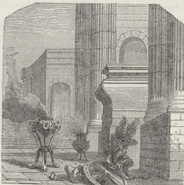
La tumba de Mausoleo.

que destruye sus obras y desconcierta sus planes cuando van encaminados á halagar la vanidad y el orgullo del hombre. Mano, que destruyó á Babilonia, arruinó el templo de Jerusalem, derribó las murallas de Jericó, echó por tierra el Coloso de Rodas, incendió el templo de Diana, separó las aguas del mar rojo para sepultaren su seno á todo un