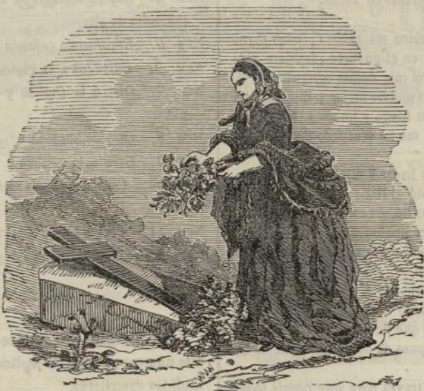
La cruz del sepulcro.