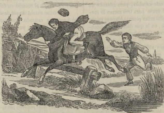
Juan á caballo.

—Escuchad, le dijo, el cambio de ese cerdo podría dar márgen á otro mucho peor para vos. En la aldea por donde acabo de pasar han robado en este mismo momento uno del corral al alcalde. Mucho temo