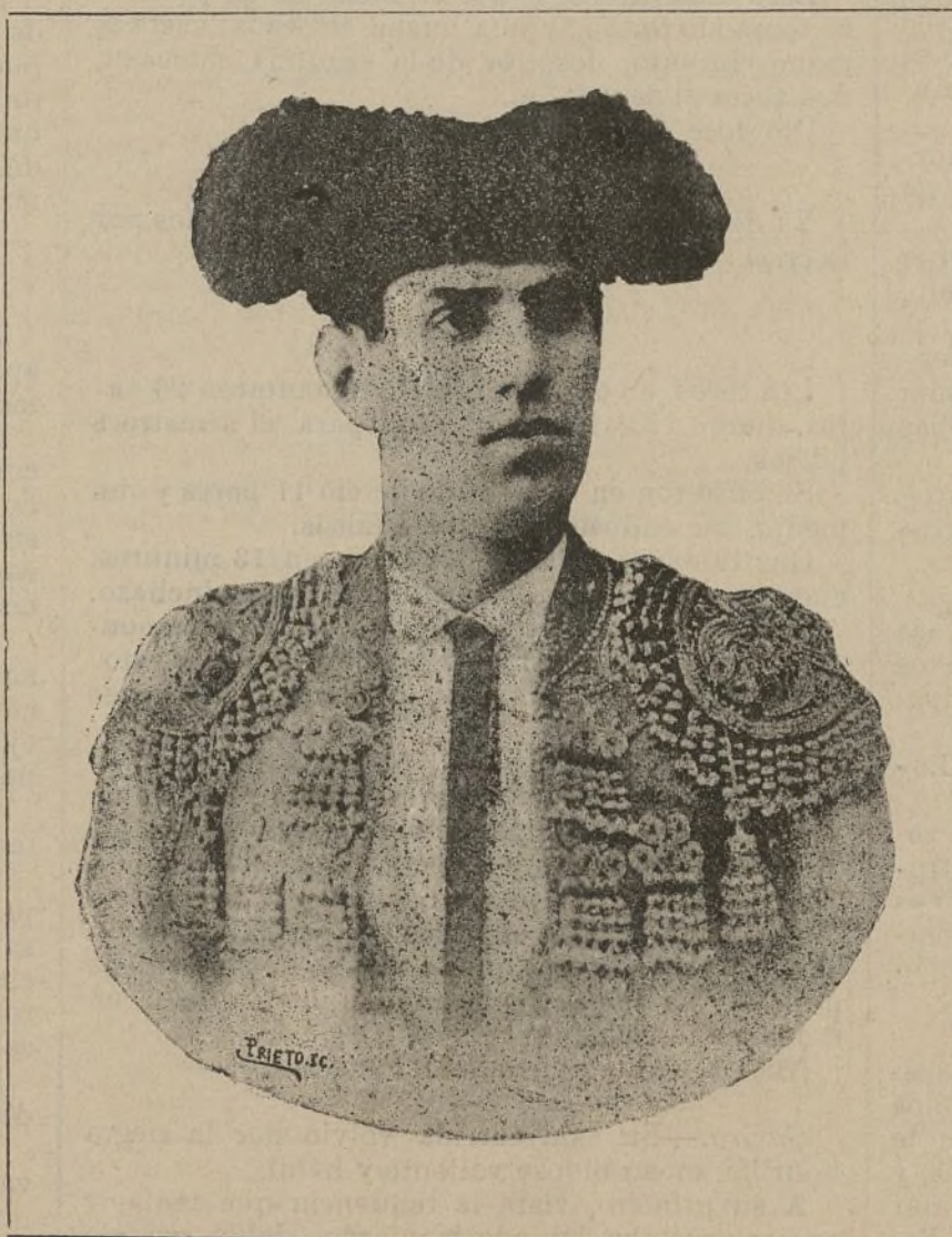
CAYETANO LEAL (PEPE-HILLO)

Bastantes de estas corridas han sido propiamente de toros, alternando en ellas