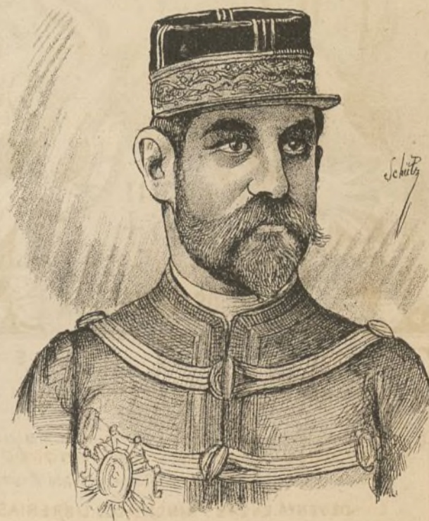
EL GENERAL BOULANGER

† en Bruselas el 30 de Setiembre de 1891