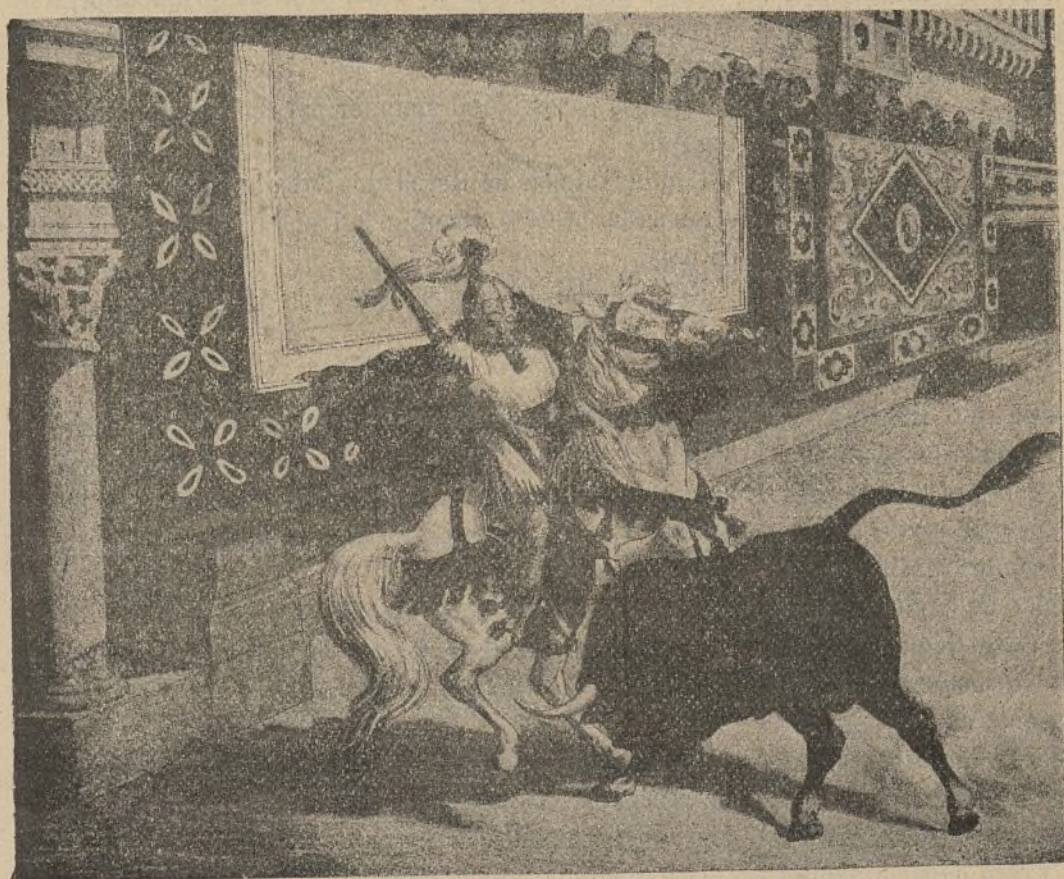
SUERTE DE LANCEAR