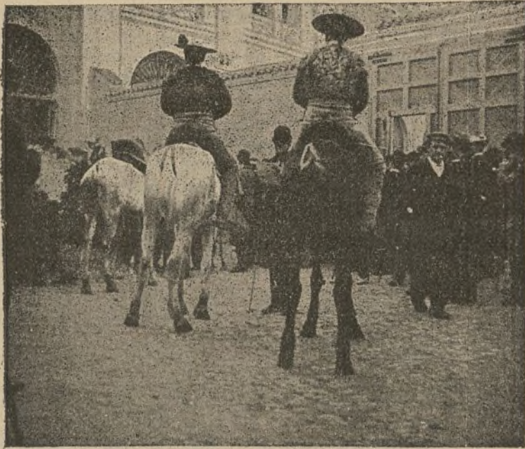
(Fotografiado de La Tauromaquia de Guerrita, que publica la casa editorial de Núñez Samper, á un real cada cuaderno.)