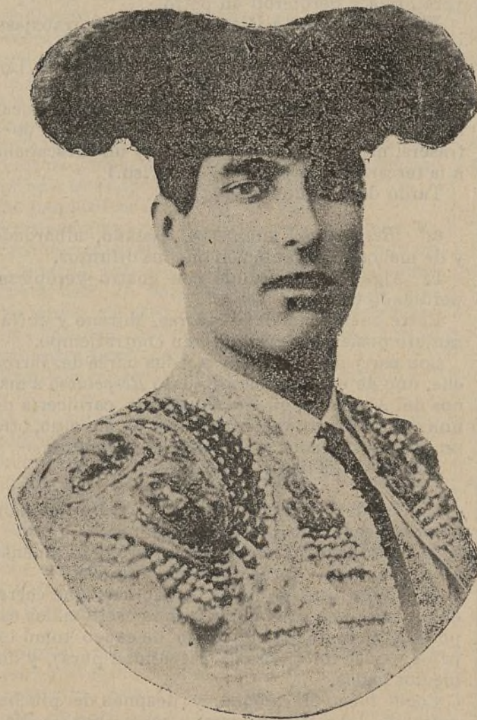
JOSÉ GARCÍA (el ALGABEÑO)

El resultado del trabajo del Algabeño en dicha tarde no fué el que esperaban muchos aficionados; pero, sin embargo, puso de relieve que en el debutante había