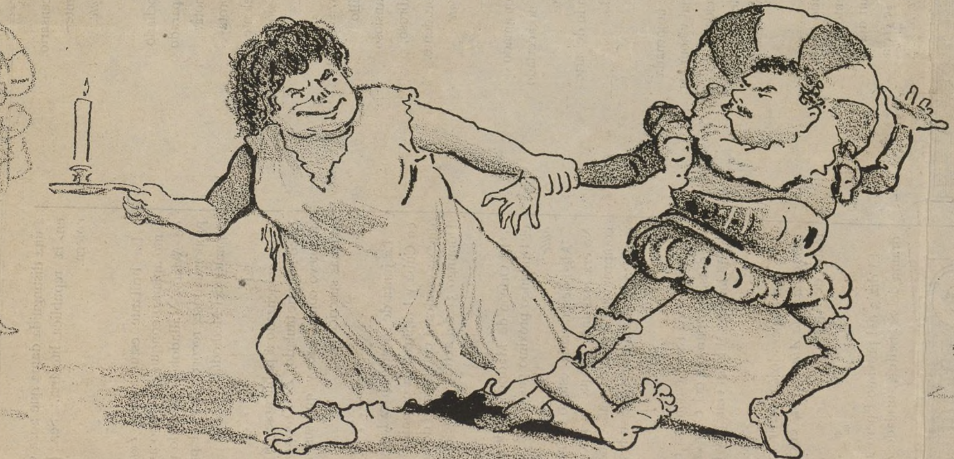
No entro por uvas.