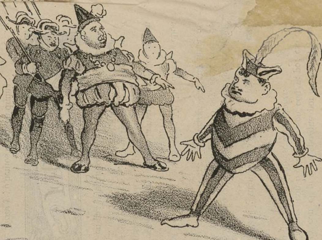
Cayó en el garlito.