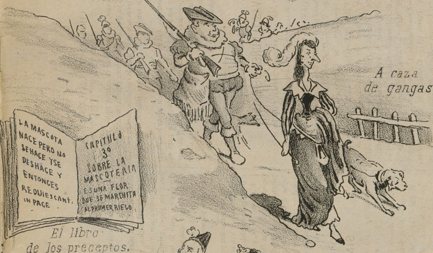
A caza de gangas.