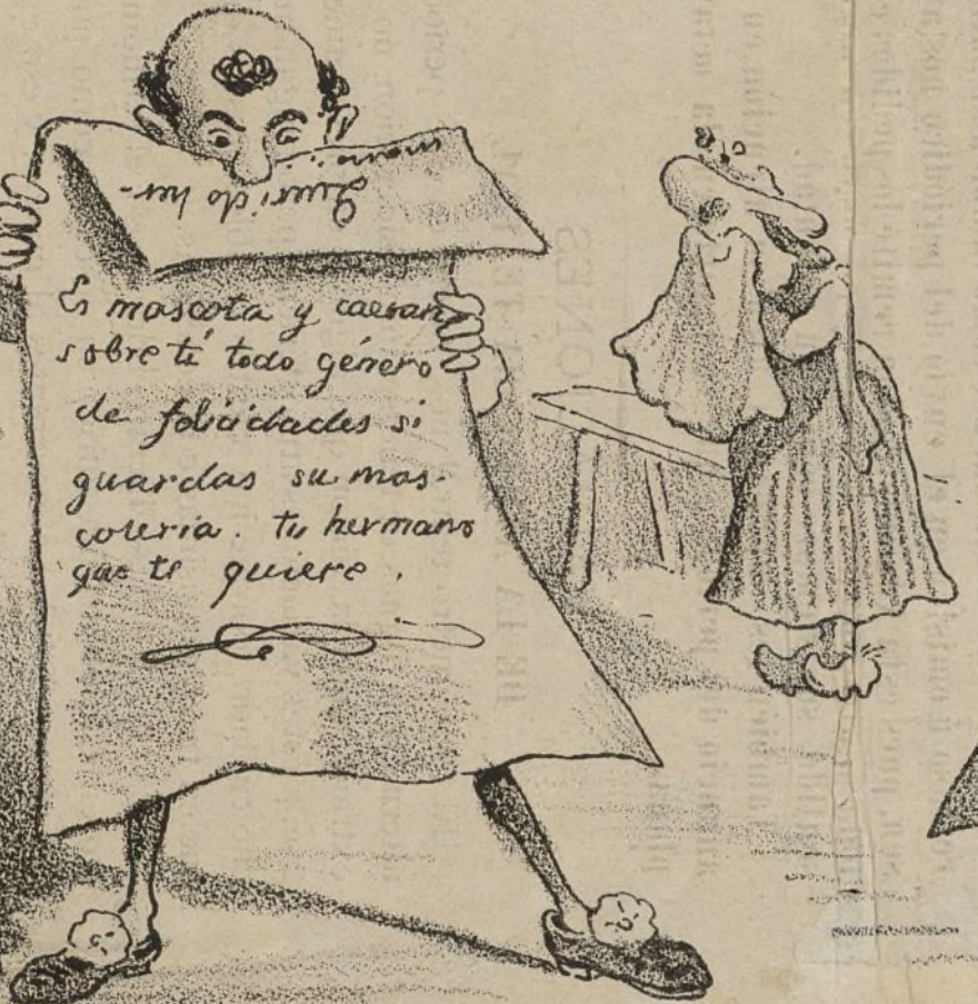
La carta de Urias.