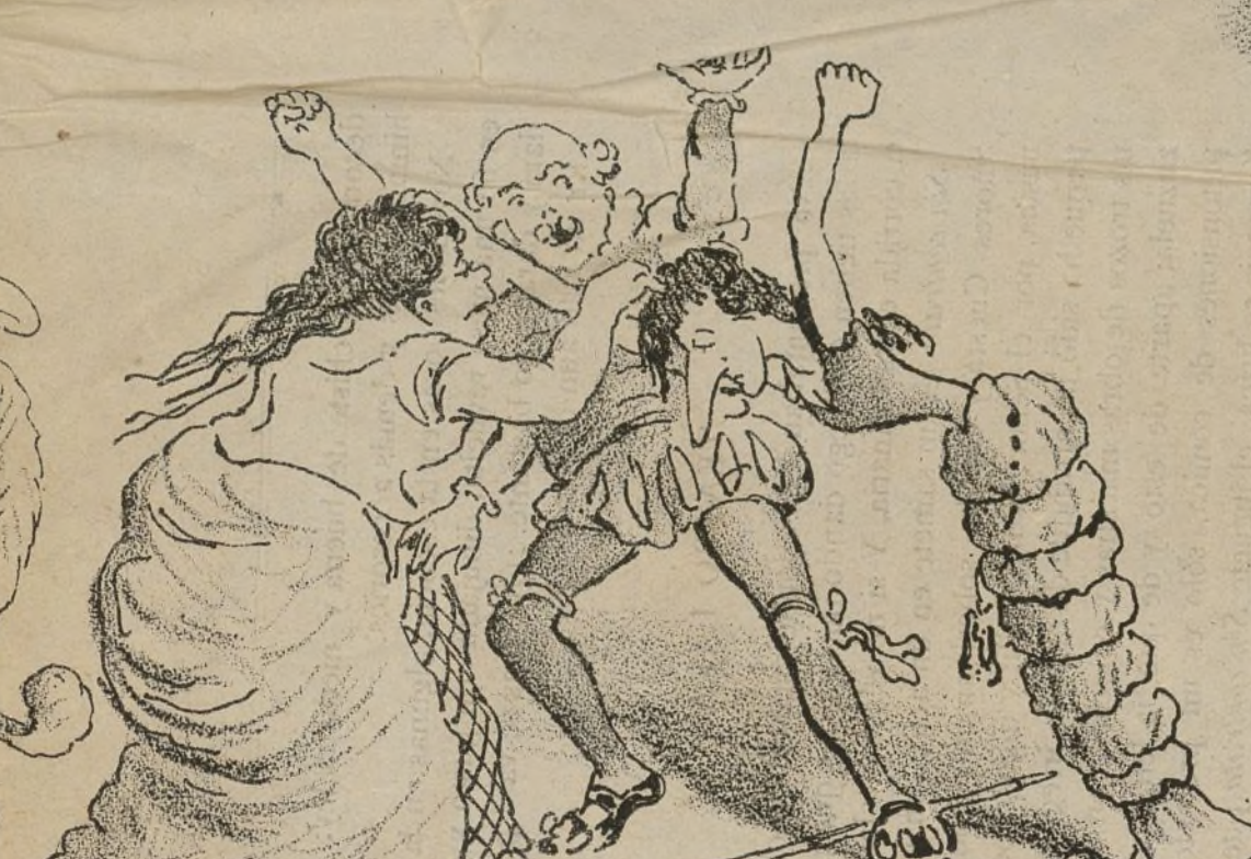
Carambola y bronca.