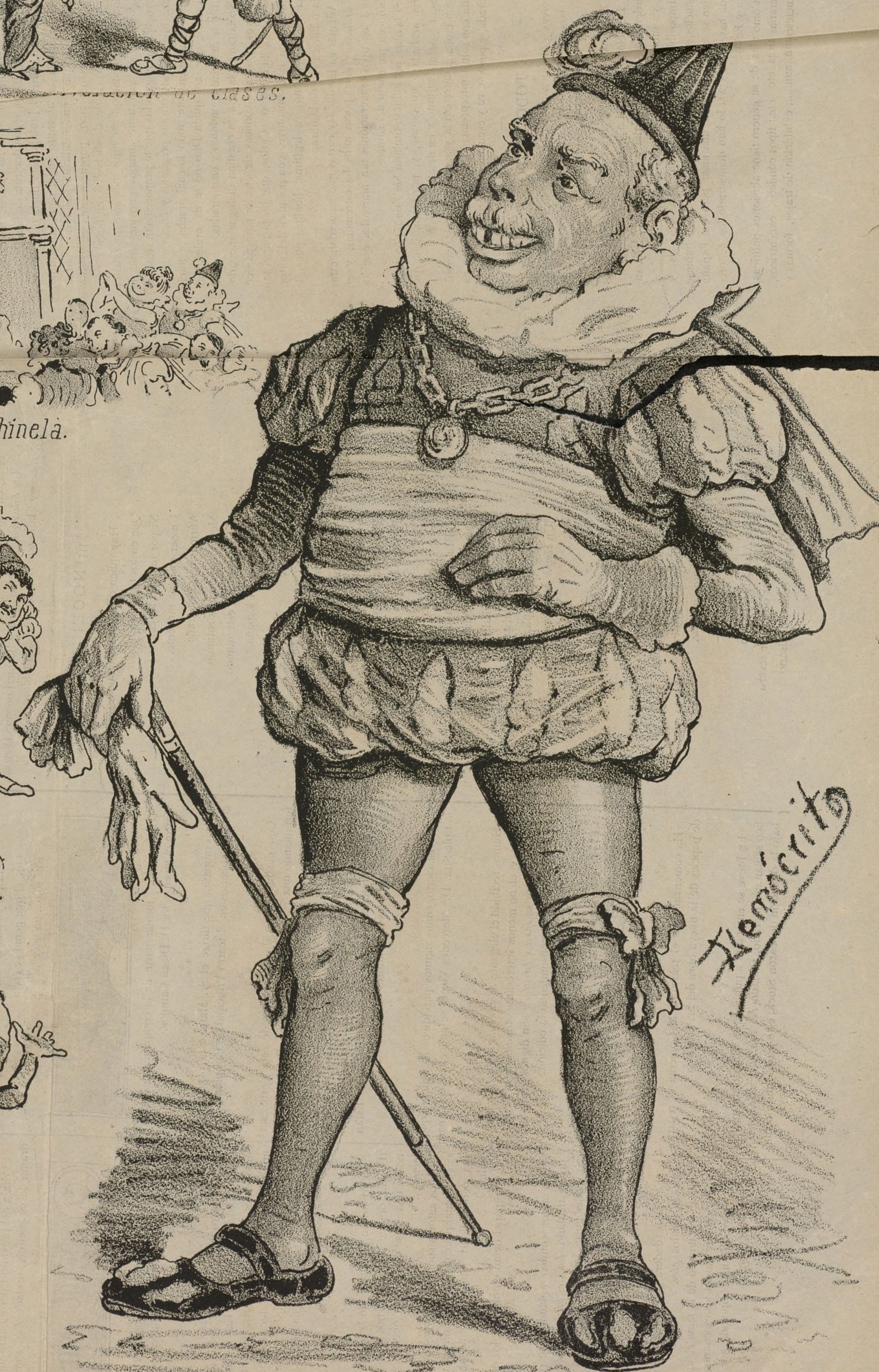
Por Rey de Guardarropia Le alzó la Mascoteria.