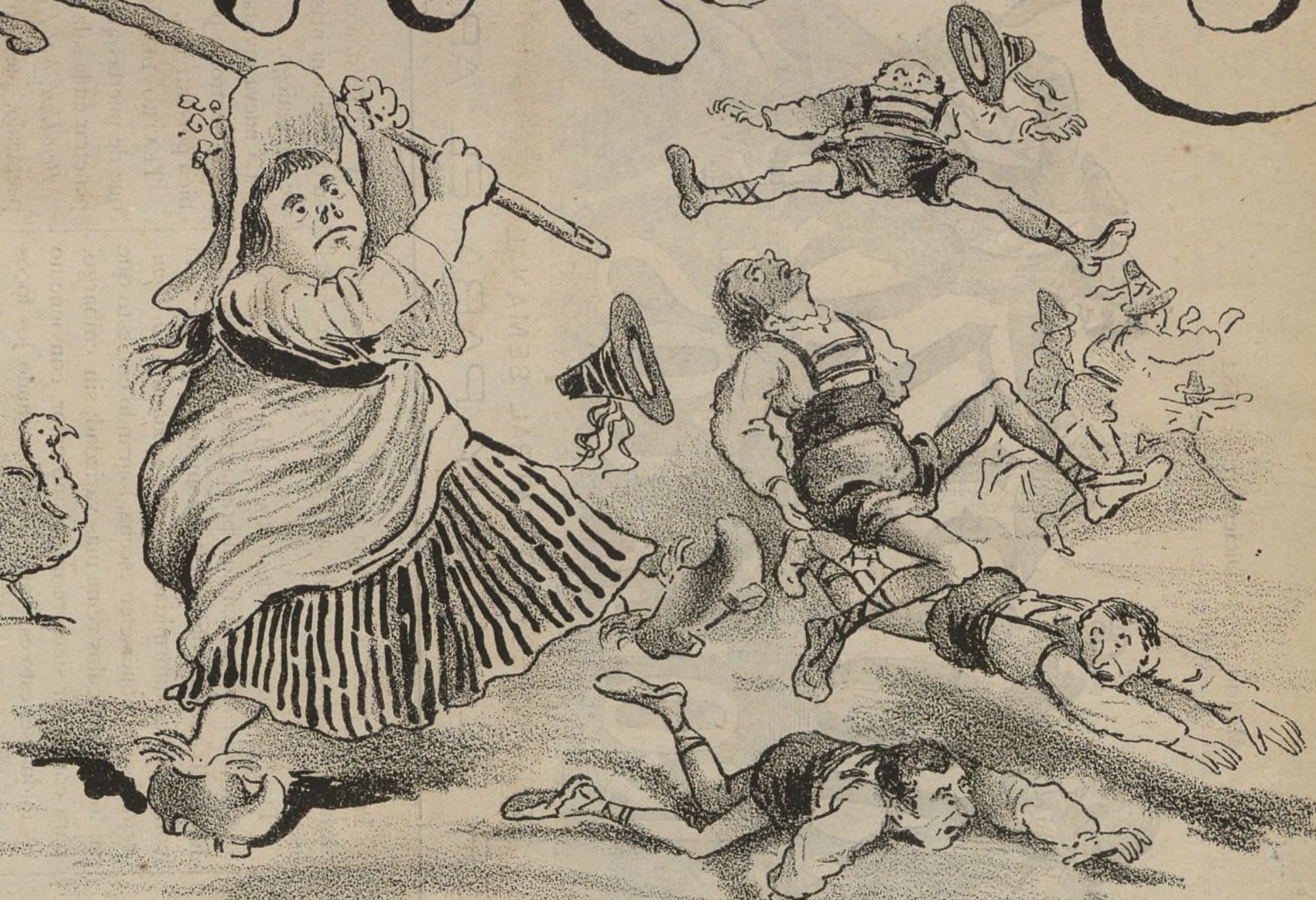
Defendiendo su mascoteria.