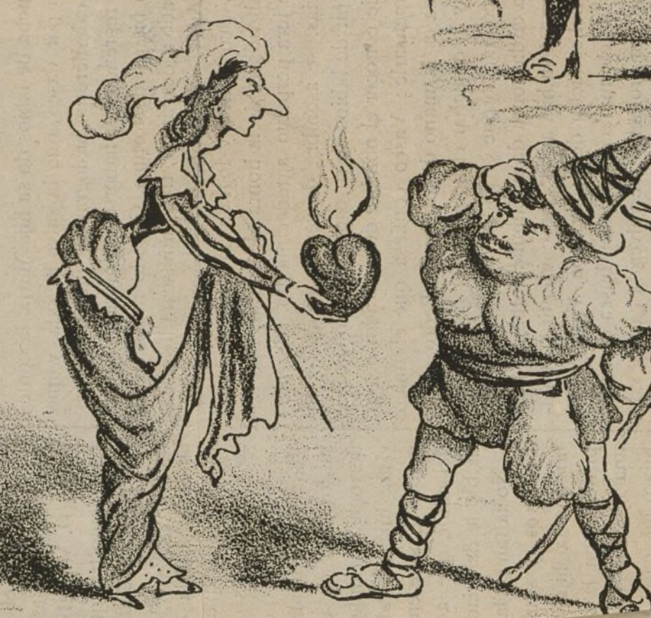
Un casto beso.