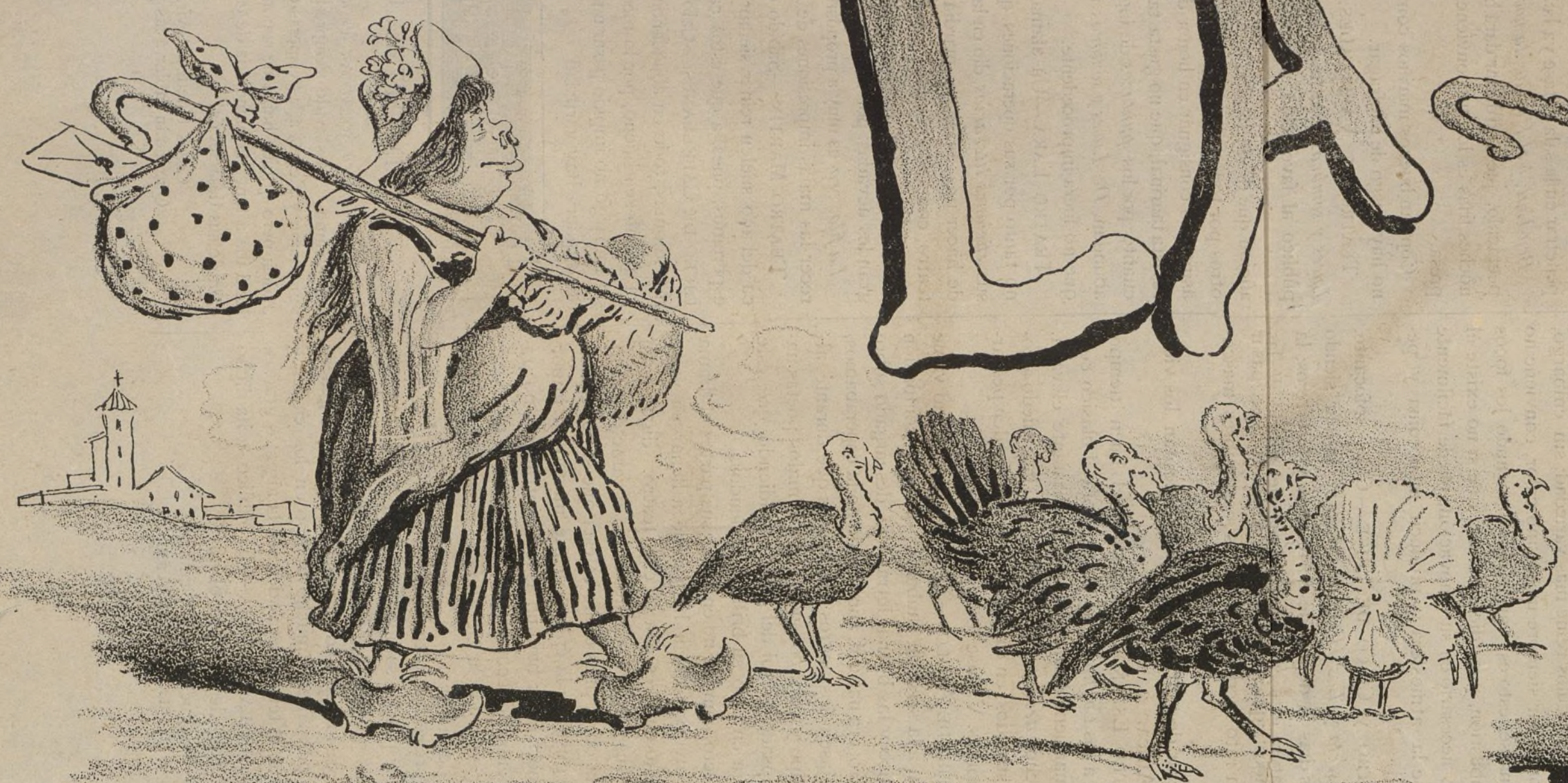
Mira que pavo... pavoroso porvenir.