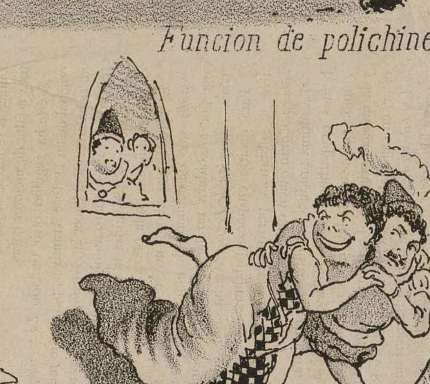
Funcion de polichinela.