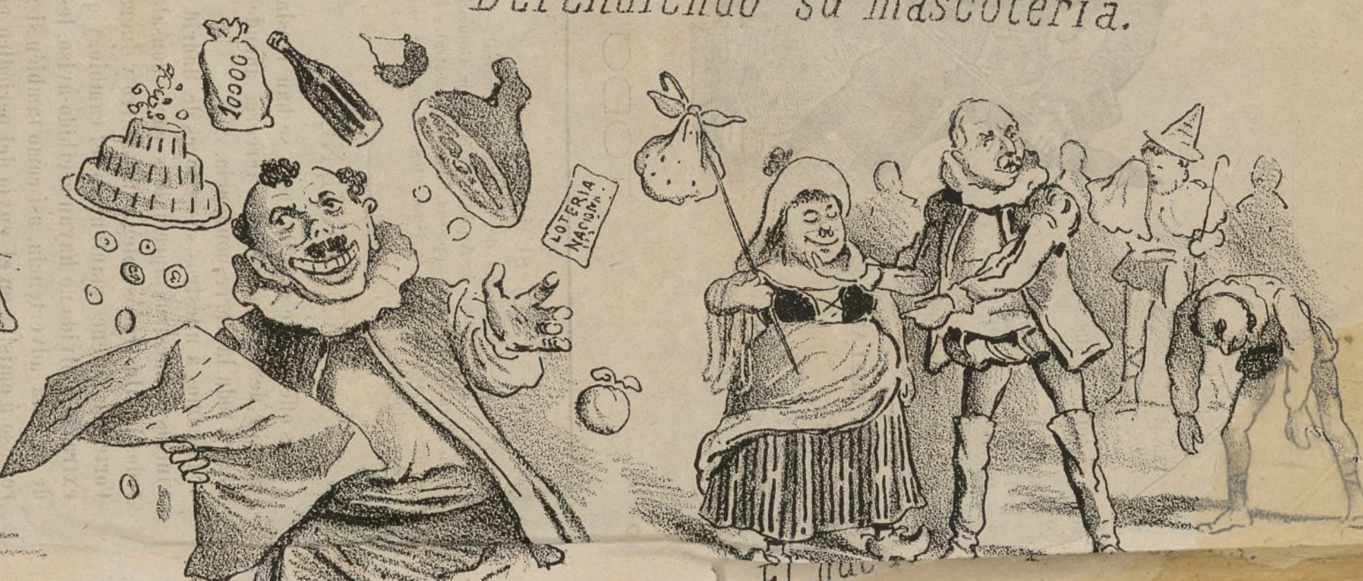
Como en Javia.