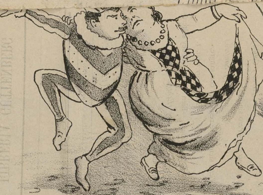
Danza del Fantoche.