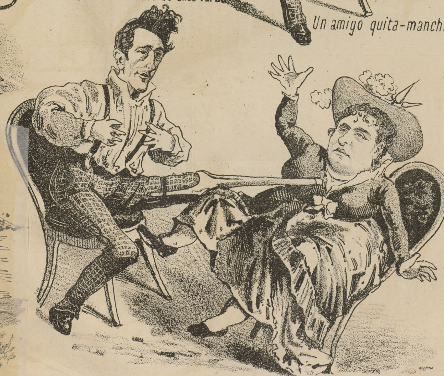
Pero metió la pata.