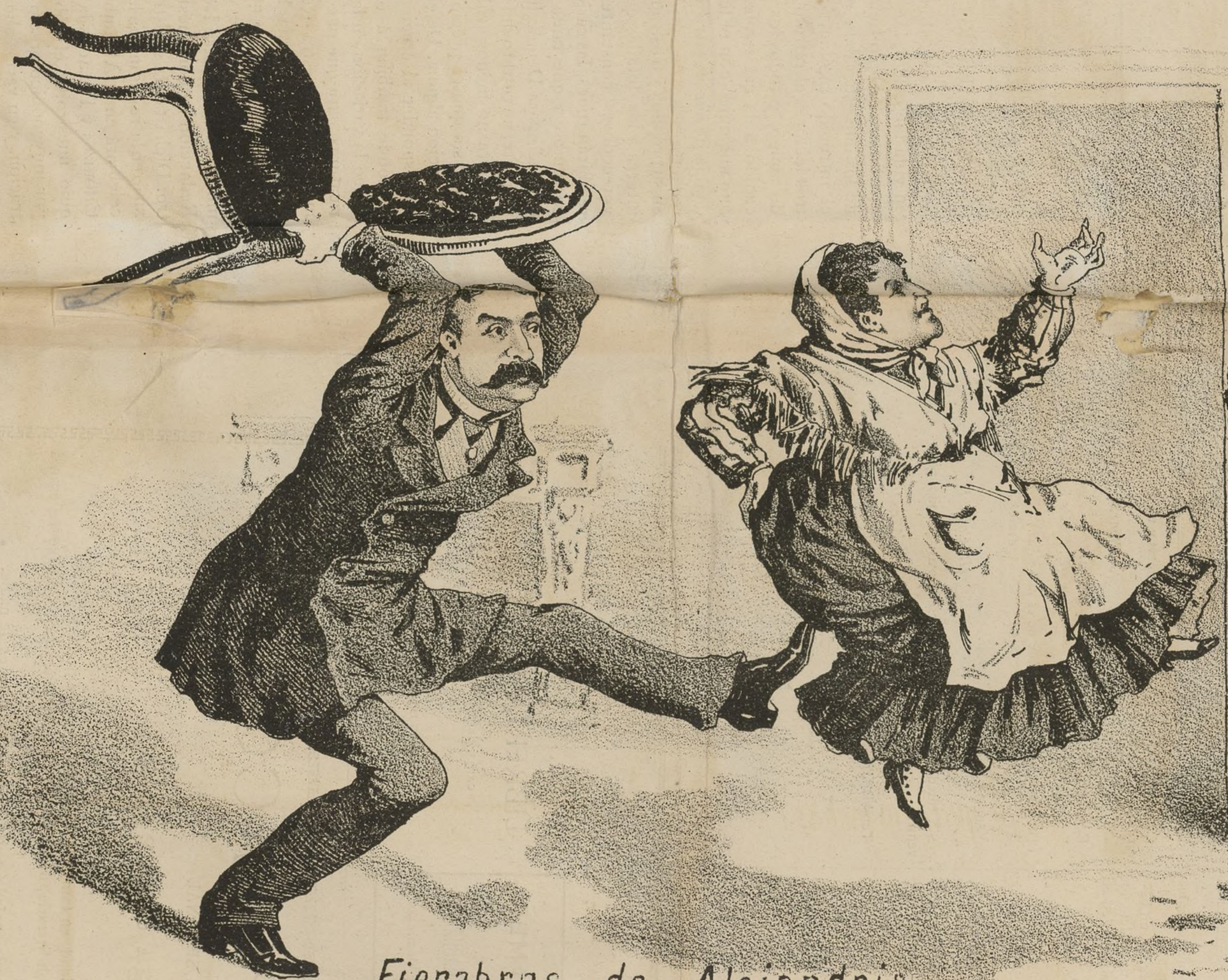
Fierabras de Alejandria.