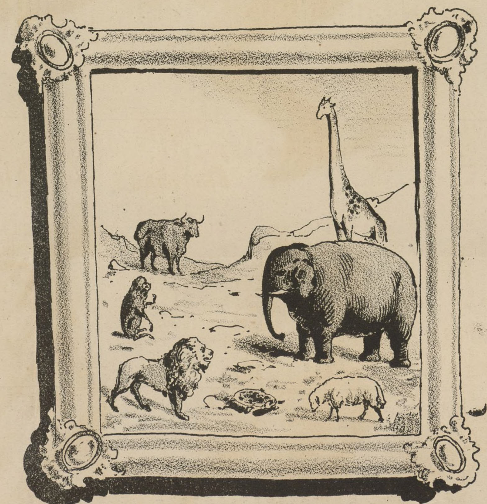
¿Dónde están las codornices?