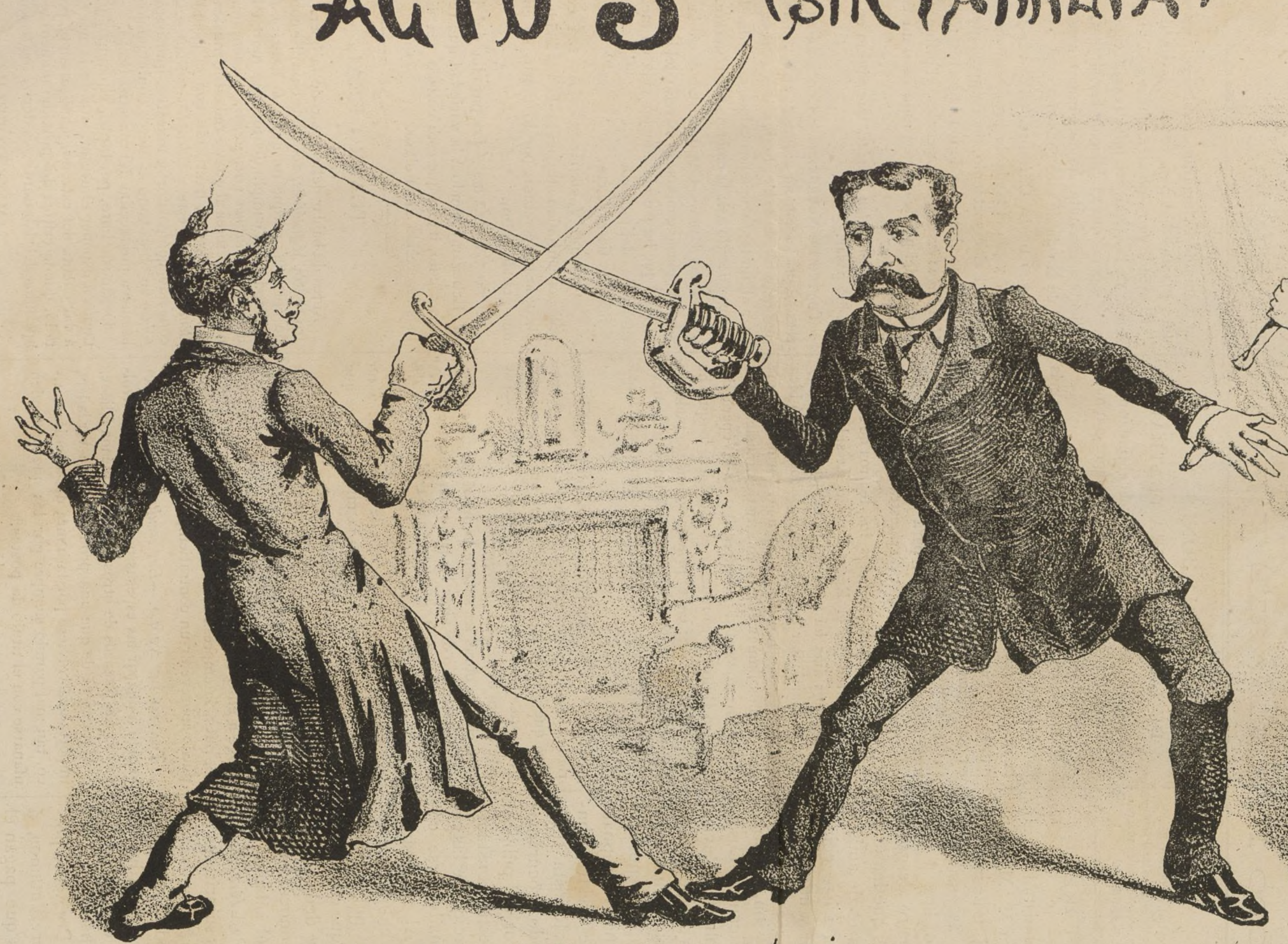
No llegará la sangre al río.