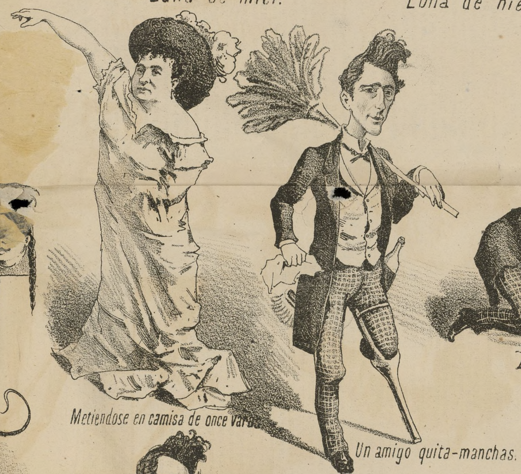
Metiéndose en camisa de once varas.