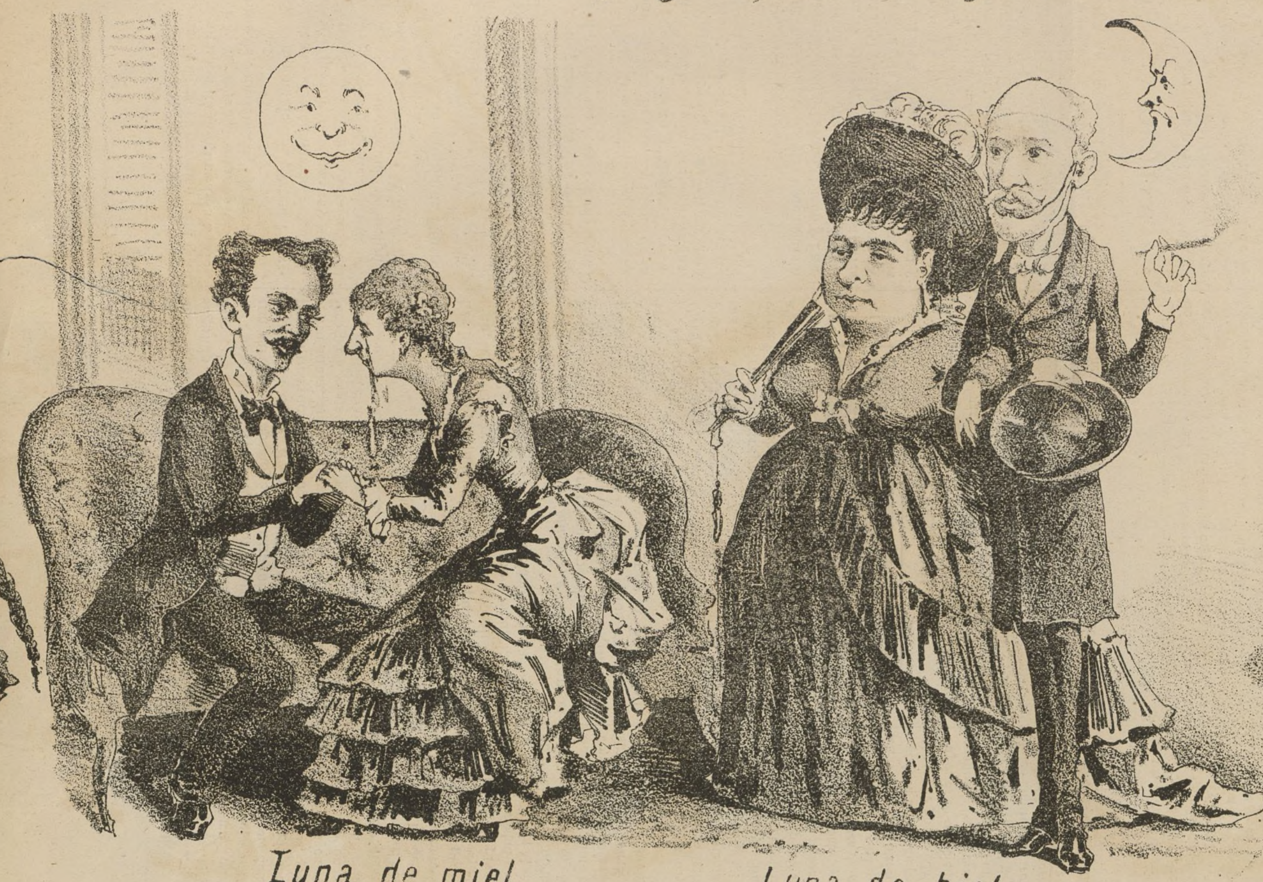
Luna de miel.