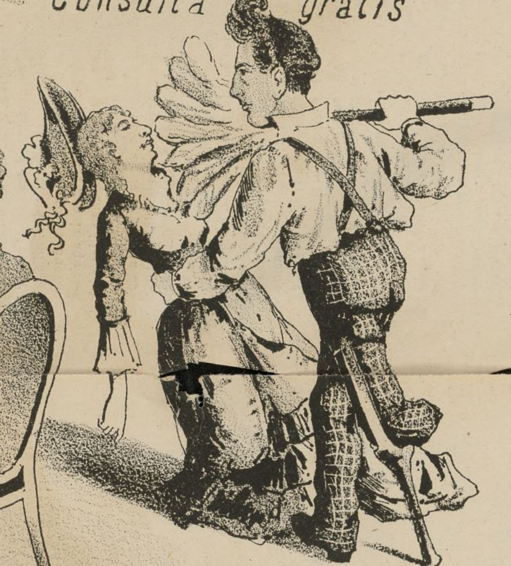
Y corre vé y dile.