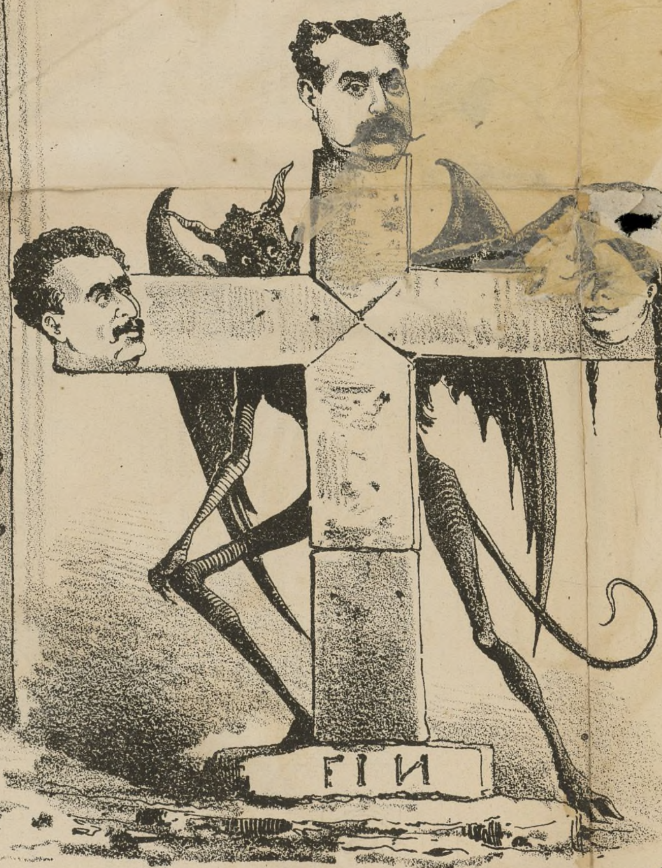
Ved la cruz del matrimonio Con el suegro y el demonio.