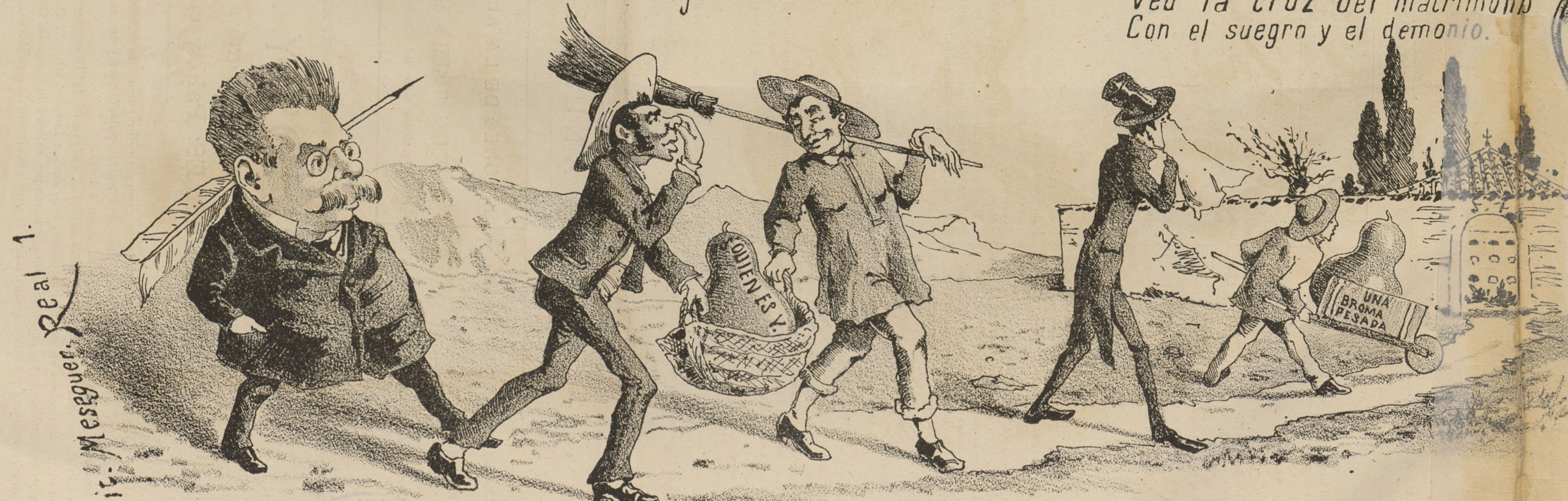
Al panteon del olvido.