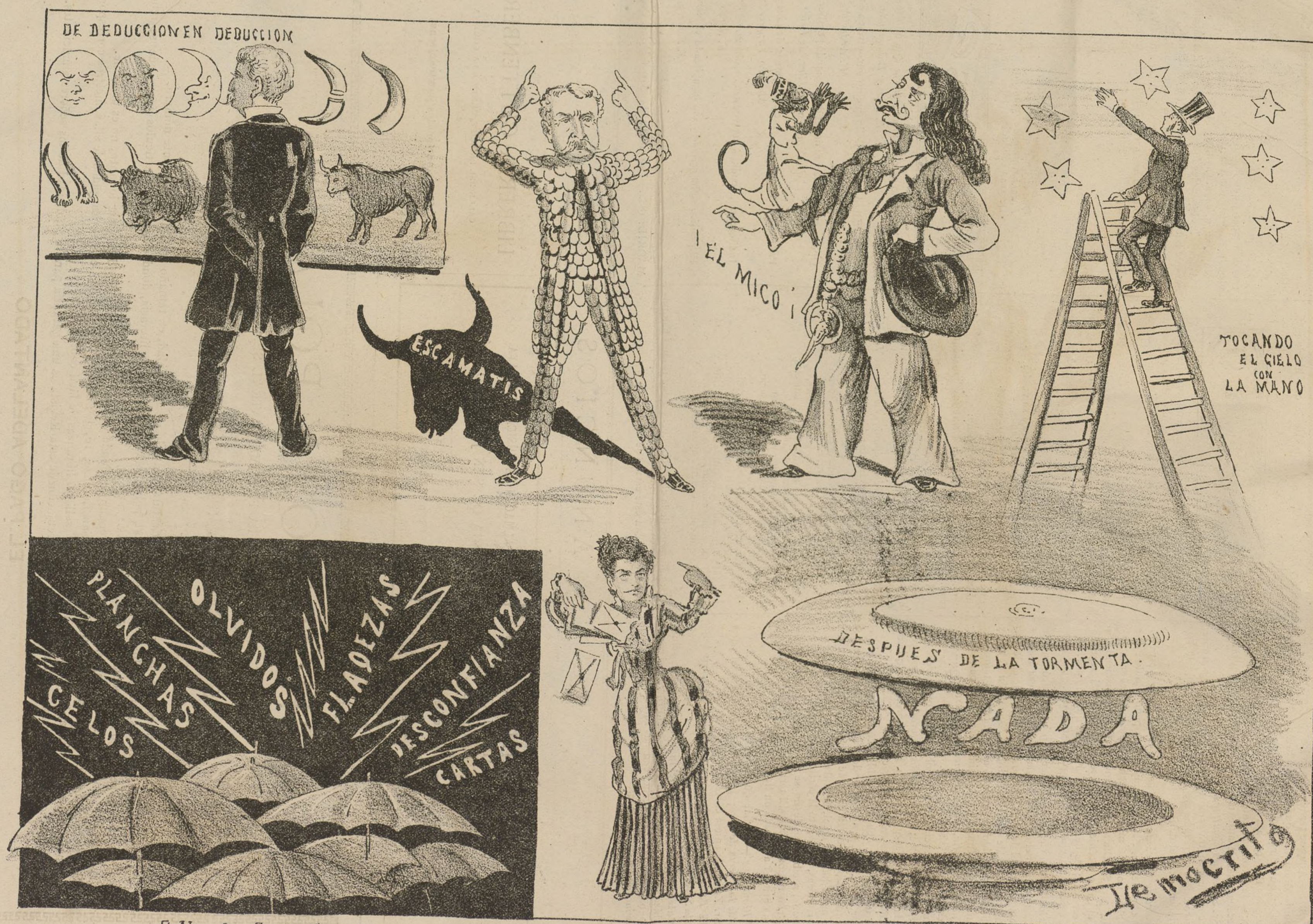
S. Nicolas 7 y 9. MADRID.