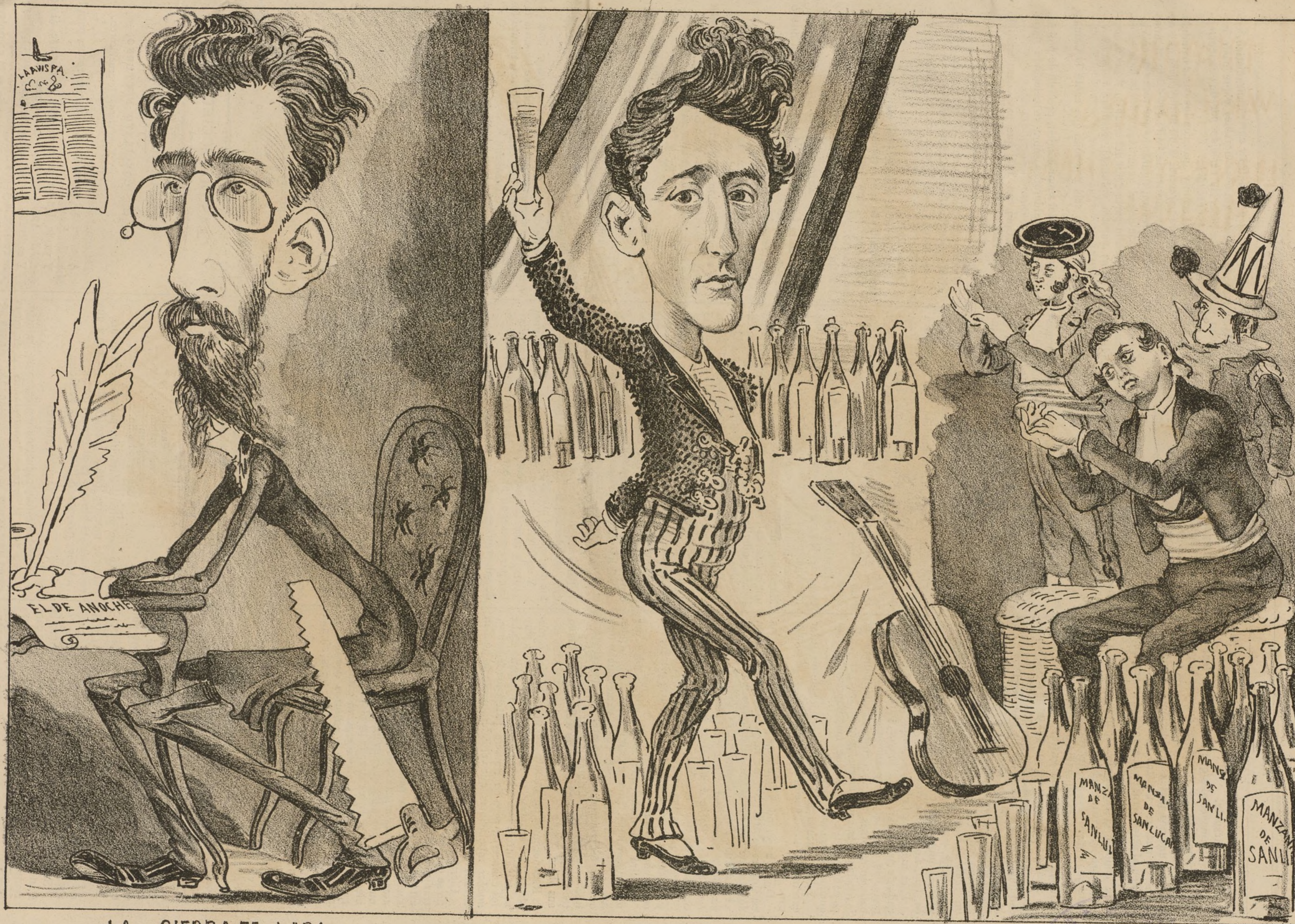
LA SIERRA DE LARA