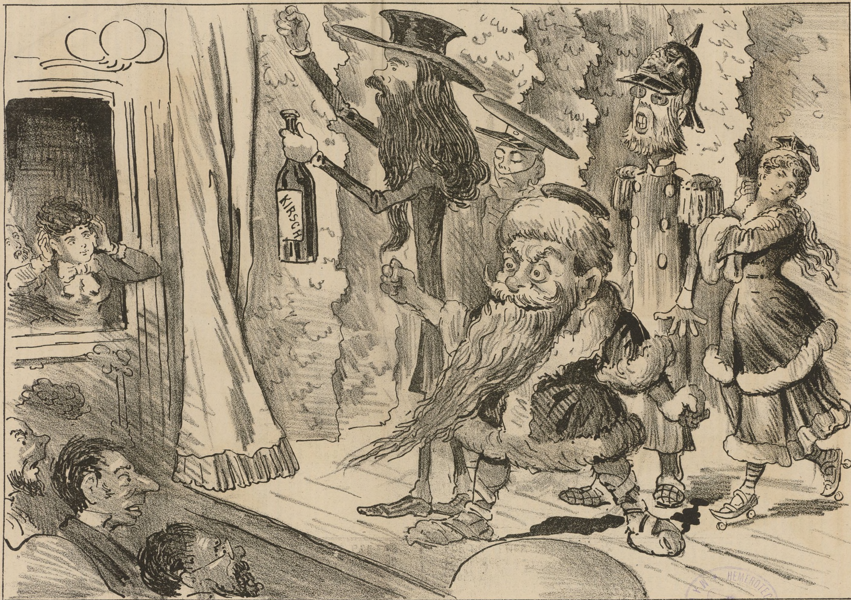
LOS ACTORES. PHILPEJNPTDHURABXXSOL-EL PÚBLICO. ENTERADOS.