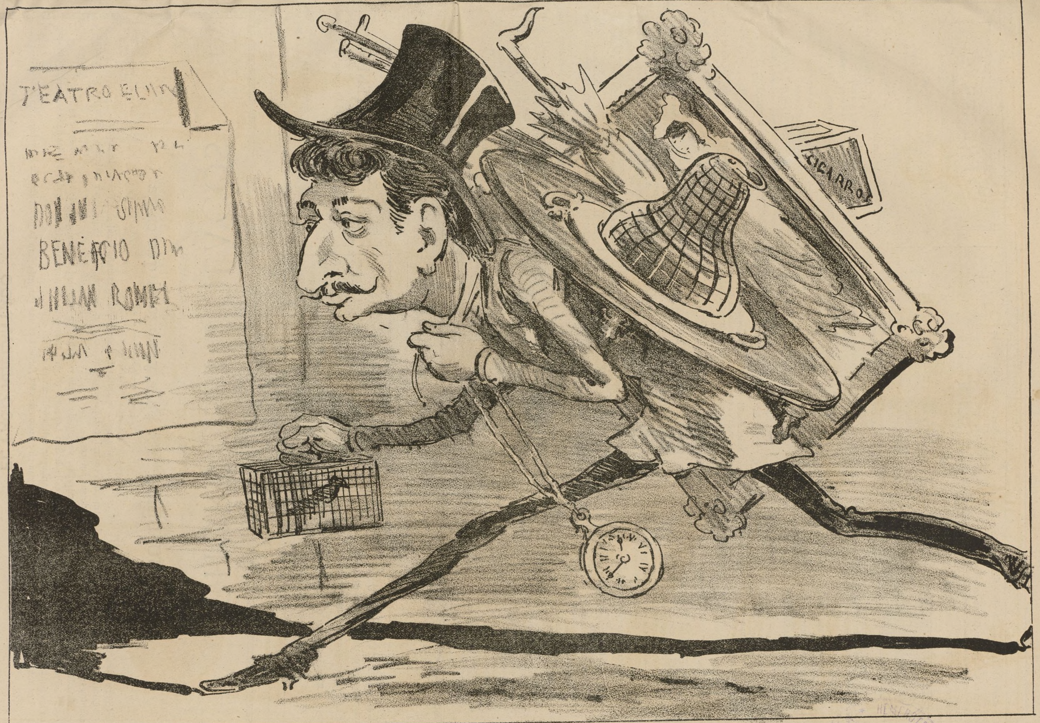
DESPUES DEL BENEFICIO.