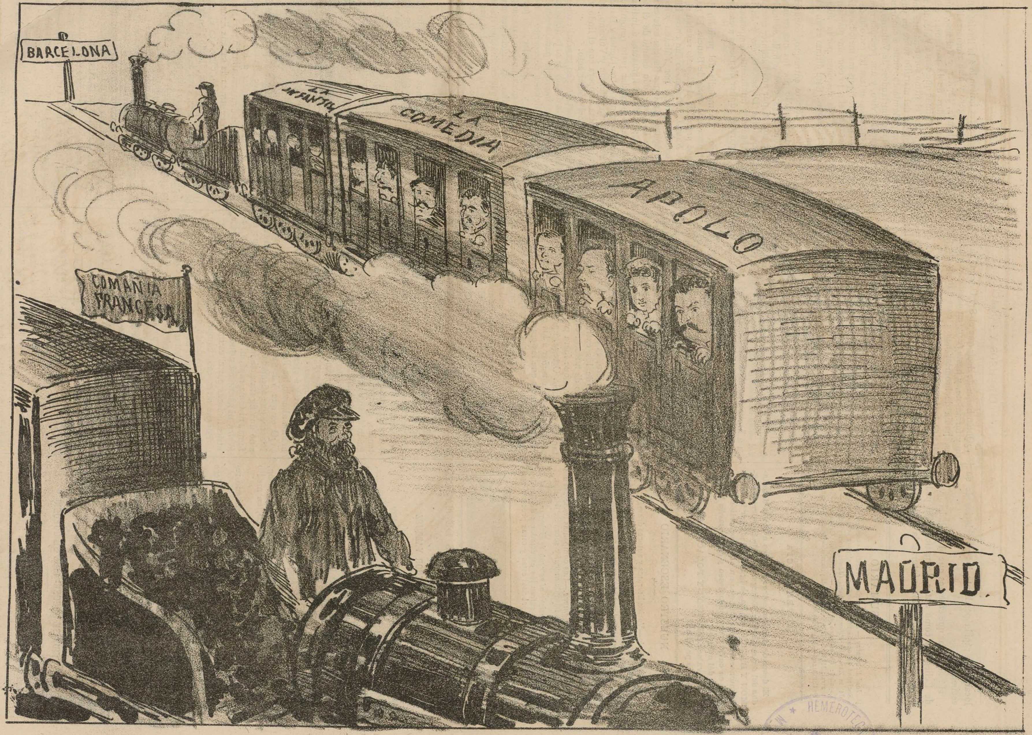
Ayuntamiento de Madrid