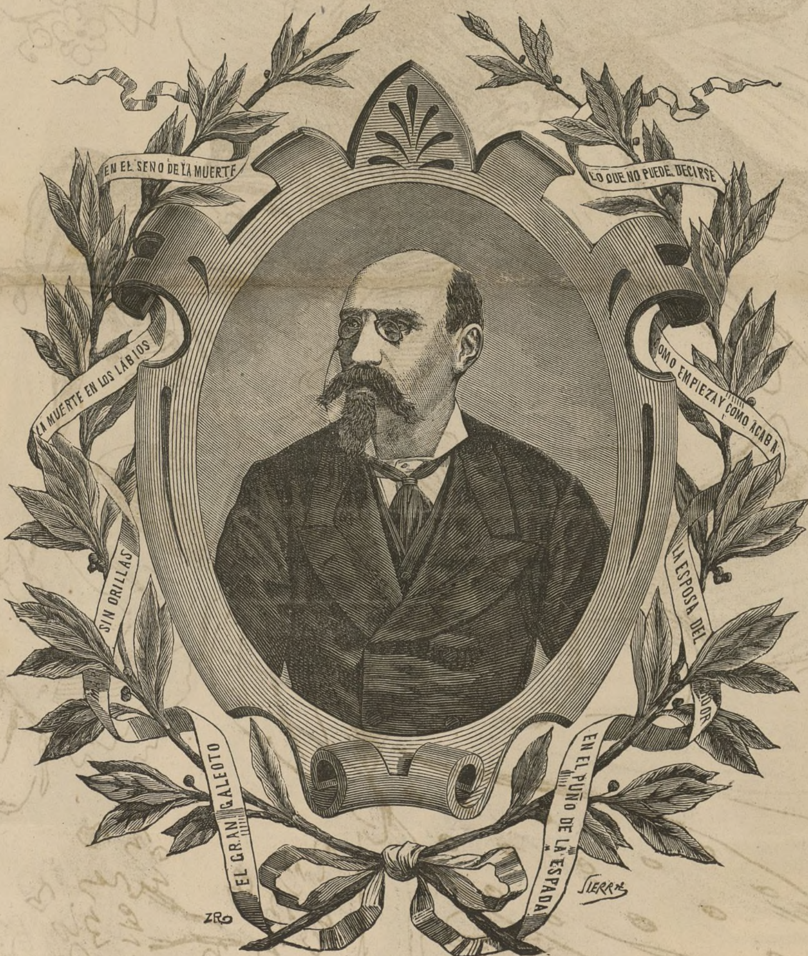
DON JOSÉ ECHEGARAY

por eso cuando oímos á algunos lamentarse de estos lunares que se notan en las producciones del dramaturgo, no podemos menos de buscar la causa de esos yerros en el público y en los admiradores de Echegaray. Cuantas veces ha pretendido separarse del camino fatal del efectivismo, le han vuelto á co-