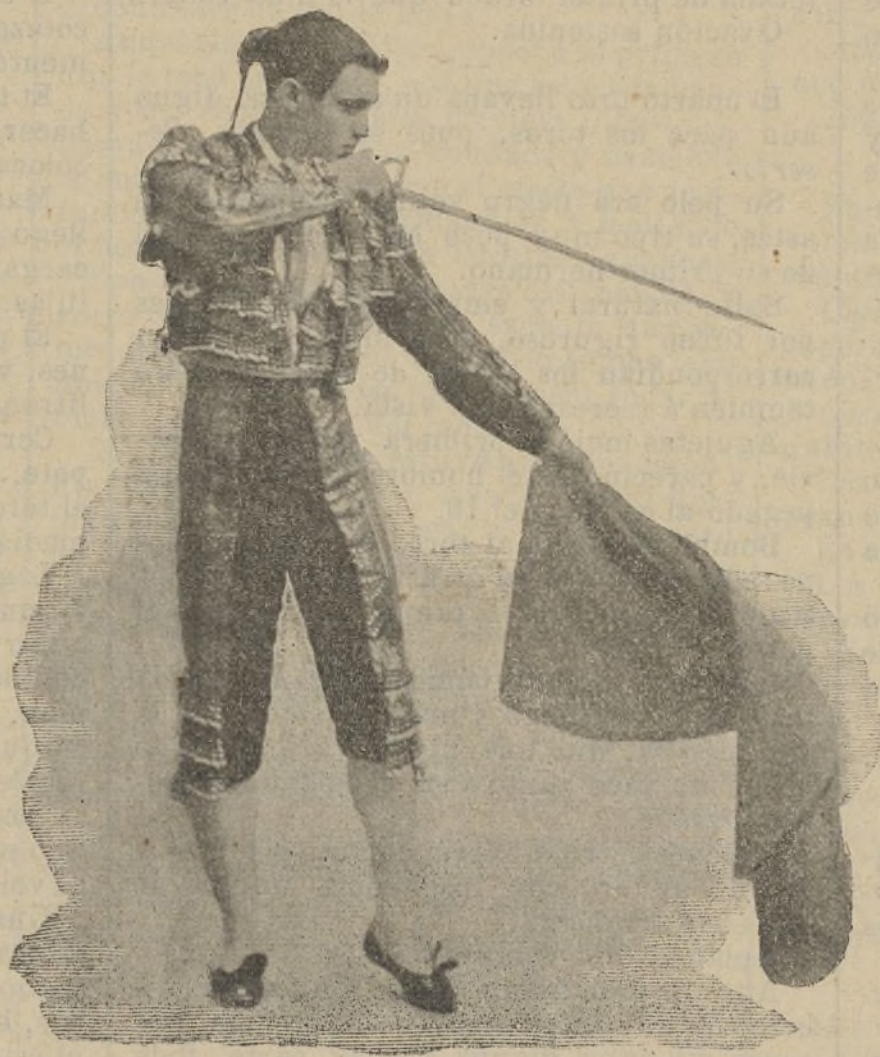
MACHAQUITO ENTRANDO A MATAR

Después de unos cuantos capotazos de mala fe, de los que prodigan los peones, terció Bombita, y en los terrenos del 1 dió cuatro artísticas verónicas, de las que resultaron inmejorables la primera y la penúltima, y terminó con una navarra en que el toro quiso quedarse con el capote sin conseguirlo. (Palmas.)