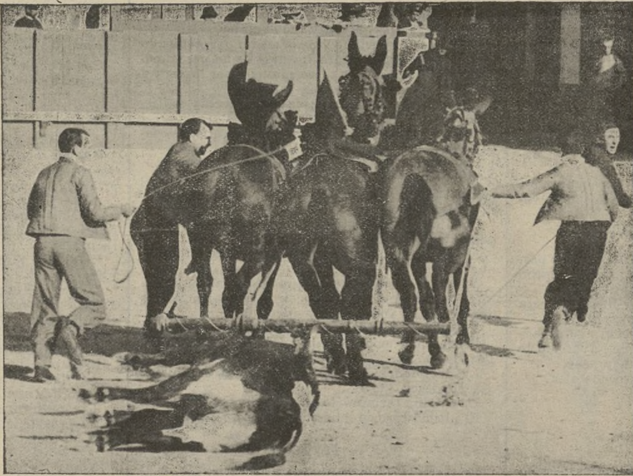
ARRASTRE DE UN TORO POR LAS MULILLAS

De Surga; negro zaino, núm. 85; atiende por Naranjero .