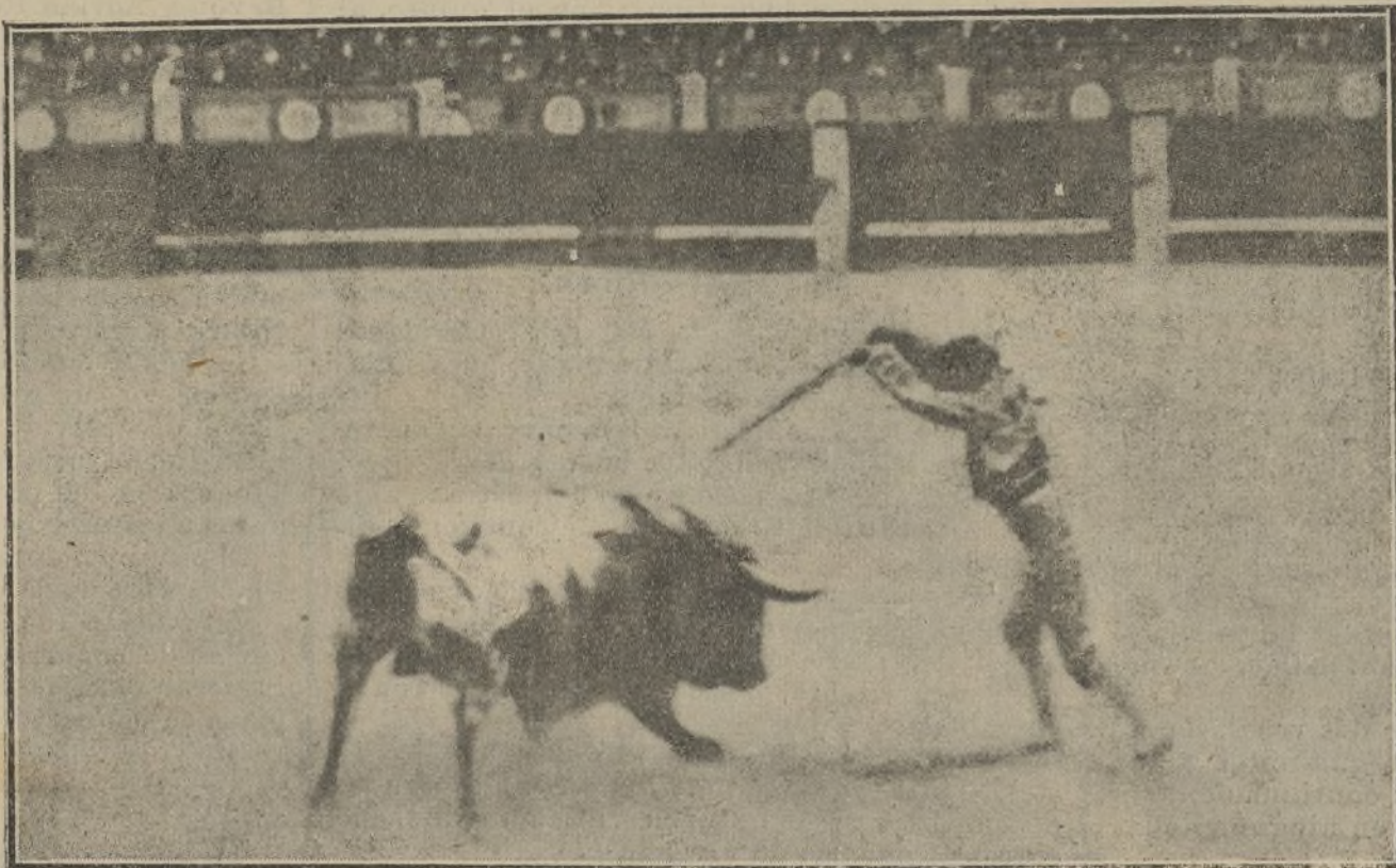
GAONA ENTRANDO A BANDERILLEAR

Al fin logró dar el primer pinchazo en hueso, y otro más que el bicho escupió, para una estocada en los blandos, saliendo el espada volteado, y metiéndole el toro varias veces la cabeza al diestro en el suelo destrozándole el traje. Repuesto el diestro acomete otra vez, y