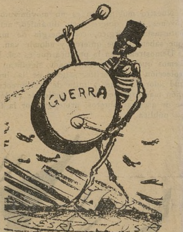
Organizad la lucha antes de que sea tarde!

De las experiencias de la lucha del Congreso saldrá la acción para el porvenir. Los estudiantes tienen que ser los primeros interesados en el fortalecimiento del movimiento, en aprender para la acción eficaz contra la guerra y el fascismo. Y por último, en el próximo agosto se celebrará el Congreso Mundial de estudiantes contra la guerra y el fascismo. Los estudiantes de cada país confrontarán con sus camaradas de los demás países la situación en que la clase escolar se encuentra. Los métodos de fascización que los países «democráticos» emplean en las universidades. La situación de la universidad en los países