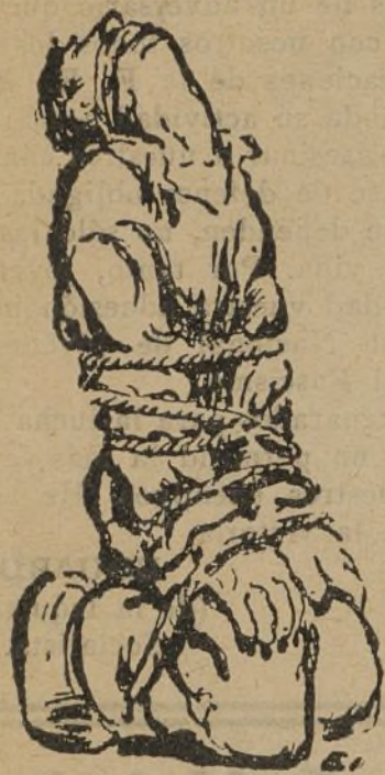
¡Eso hará el fascismo con la juventud!

CAMARADA DE LAS JUVENTUDES LIBERTARIAS Y DE LOS SINDICATOS CONFEDERALES: TU ACCION AISLADA ES INEFICAZ POR MUY HEROICA QUE SEA. TU ESFUERZO, INCORPORADO AL DEL RESTO DE LA JUVENTUD ANTIFASCISTA, NOS HARA INVENCIBLES.