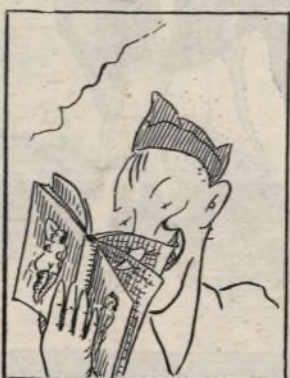
Y lee novelas galantes de las que son muy picantes.