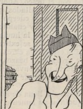
La cerradura ha tapado y en la puerta se ha apoyado.