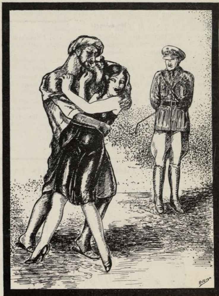
¡Una hija del pueblo!

...Y a ti, en el suelo tirada, sola, llena de arañazos, sin fuerzas para lanzar una queja ni un lamento, te prestará su amparo—hasta que nosotros vengamos la afrenta—tu propio corazón lavando tanta iniquidad con lágrimas.