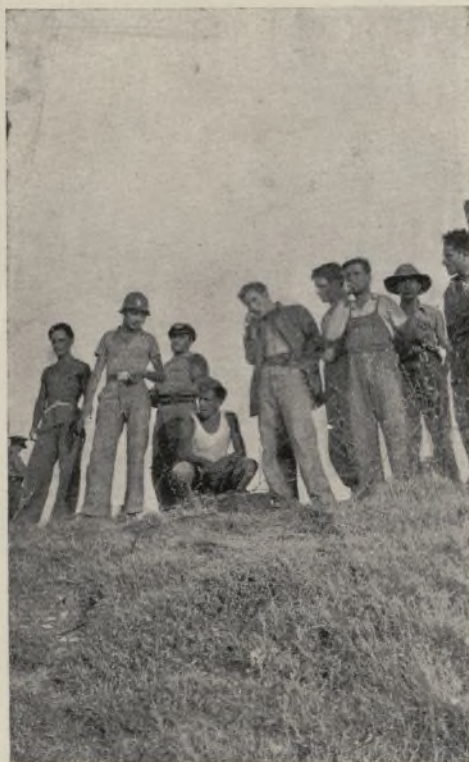
Grupo de enlace y transmisiones de campaña preparado para actuar.