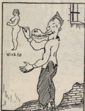
Allí el tiempo va pasando en las paredes pintando.