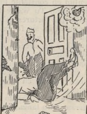
Y antes que madure el fruto en el suelo da el muy bruto.