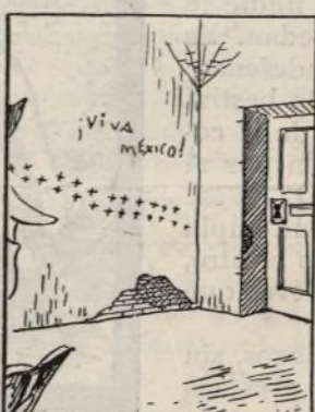
El Flauta ya se excitó... y un rincón localizó.