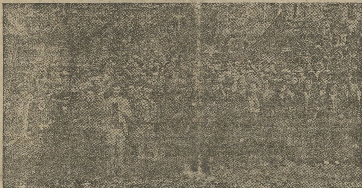
La presidencia de la magna manifestación

Un acto de Gobierno es mucho para los hombres de una tendencia si no llevan en su pensamiento una ardiente llamada de ideal. El Frente Popular la lleva, y el pueblo ratificó el domingo, en grandioso plebiscito, que el Frente sigue, no sólo en todo su vigor, sino aumentado por las potentes fuerzas obreras de ambas sindicatos, y que hoy, firme como nunca, camina seguro, asistido por todo el pueblo antifascista, por la ruta segura de la victoria.