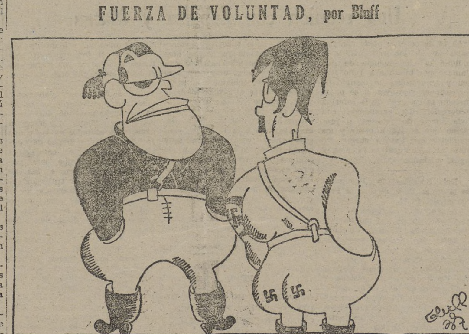
—Estamos desconocidos. Ya llevamos dos días sin vulnerar el convenio sobre voluntarios.

«La Correspondencia Diplomático-política» estima que «sólo cuando la población alemana de Checoslovaquia no considere estar sometida a autoridades extranjeras ni ser objeto de una política que no es la suya, es cuando Checoslovaquia podrá cumplir una función útil en la vida europea, libertándose de la pesadilla de alianzas en que actualmente ve el único medio de asegurar su integridad política.»