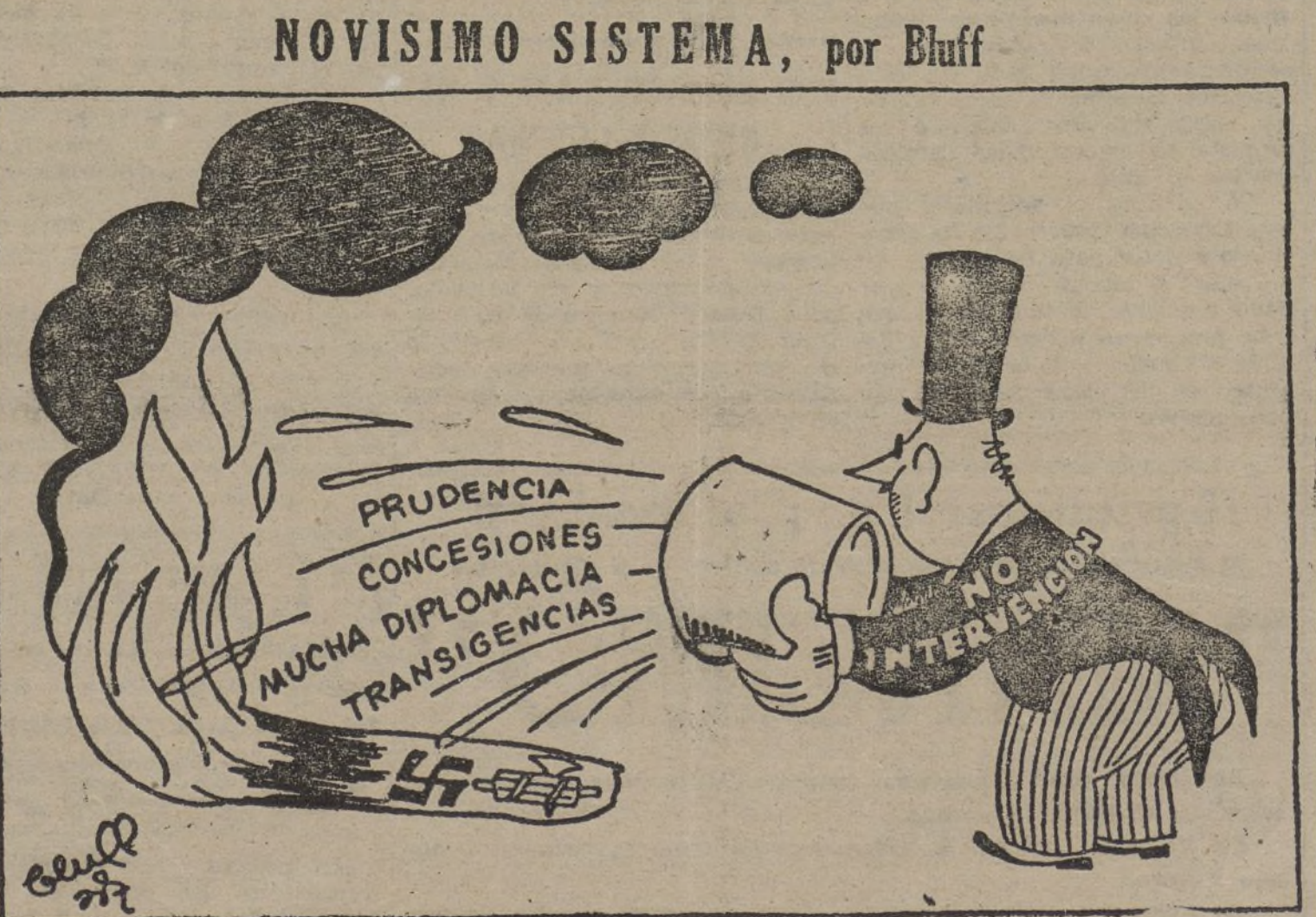
Apagando un fuego con gasolina