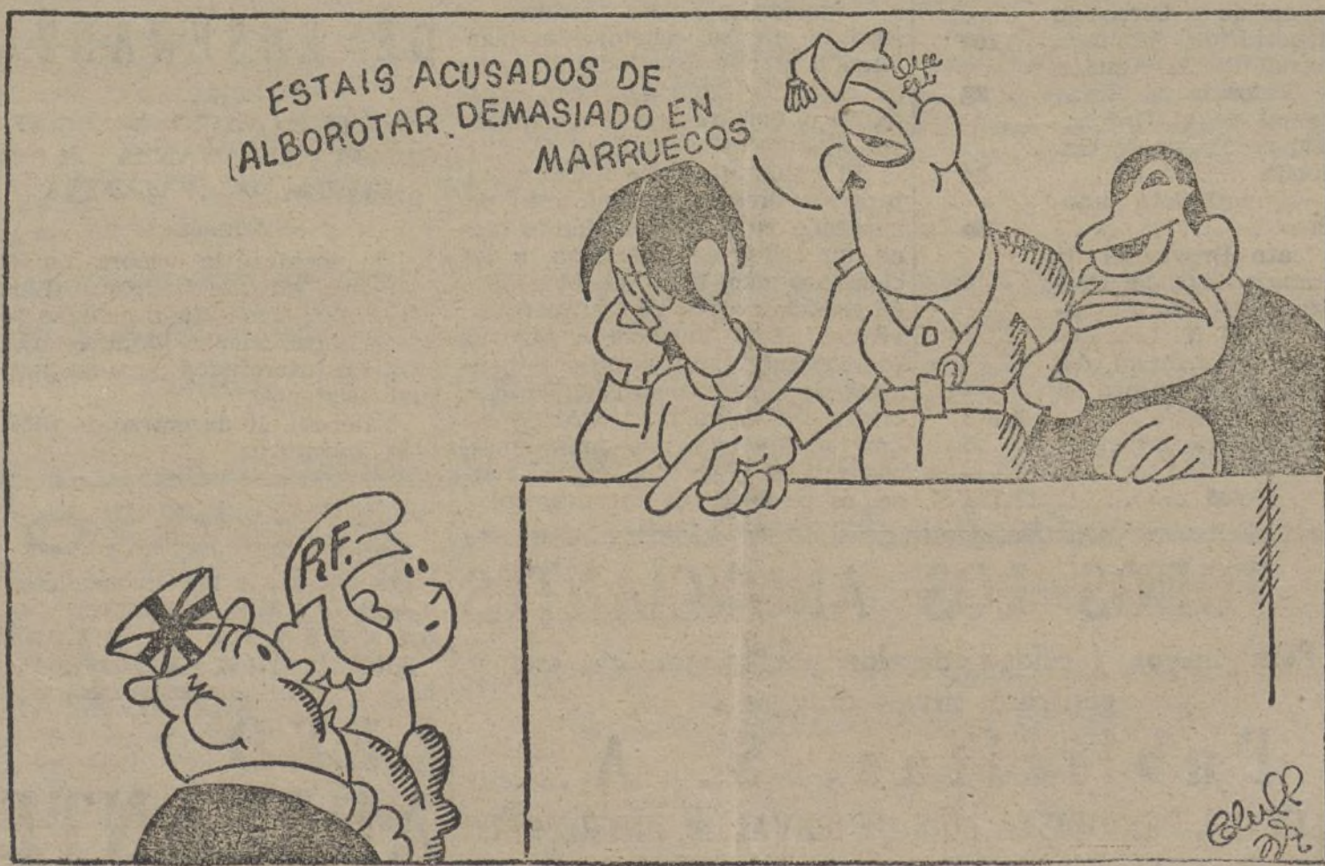
Los marroquíes juzgando a los jueces

Exigimos la asistencia de los compañeros del Grupo e invitamos al acto a todos los camaradas de los Grupos sindicales socialistas.