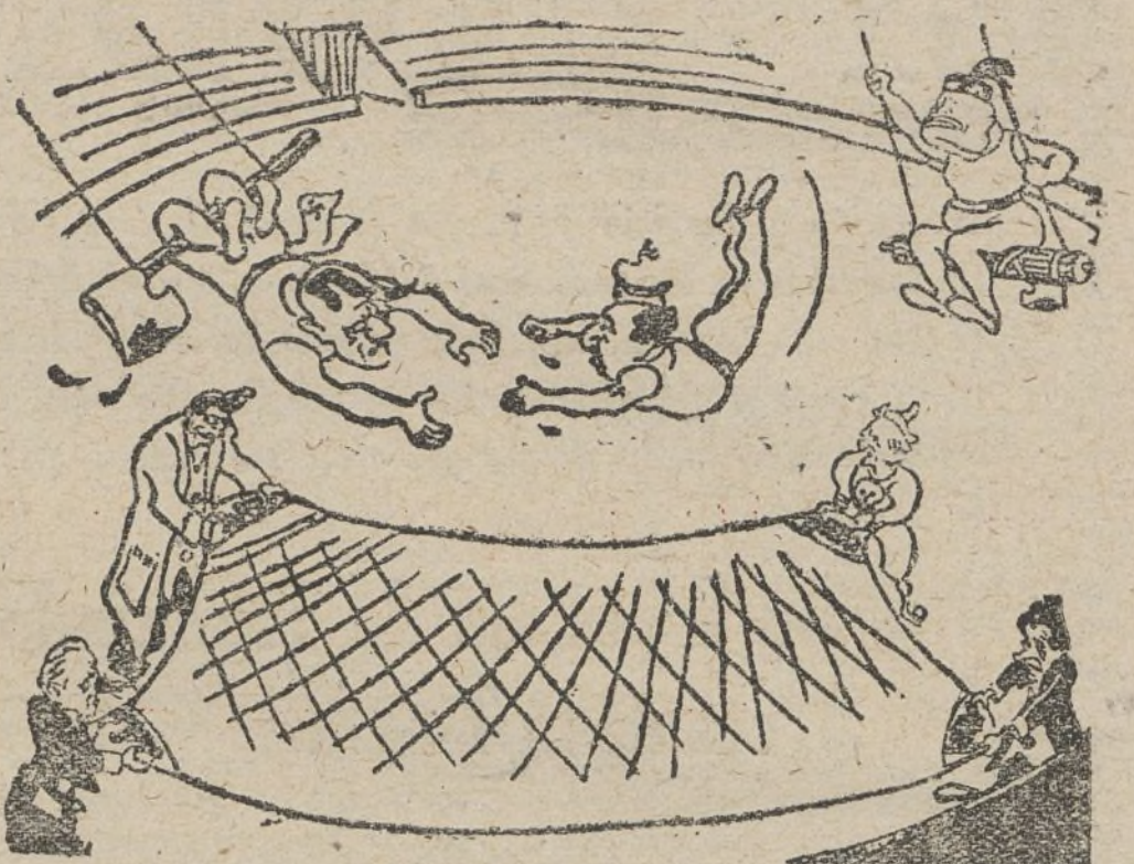
La pirueta mortal