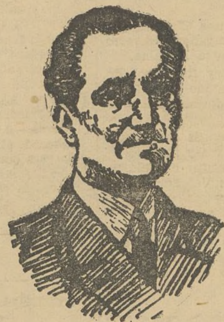
EL PRESIDENTE AGUIRRE