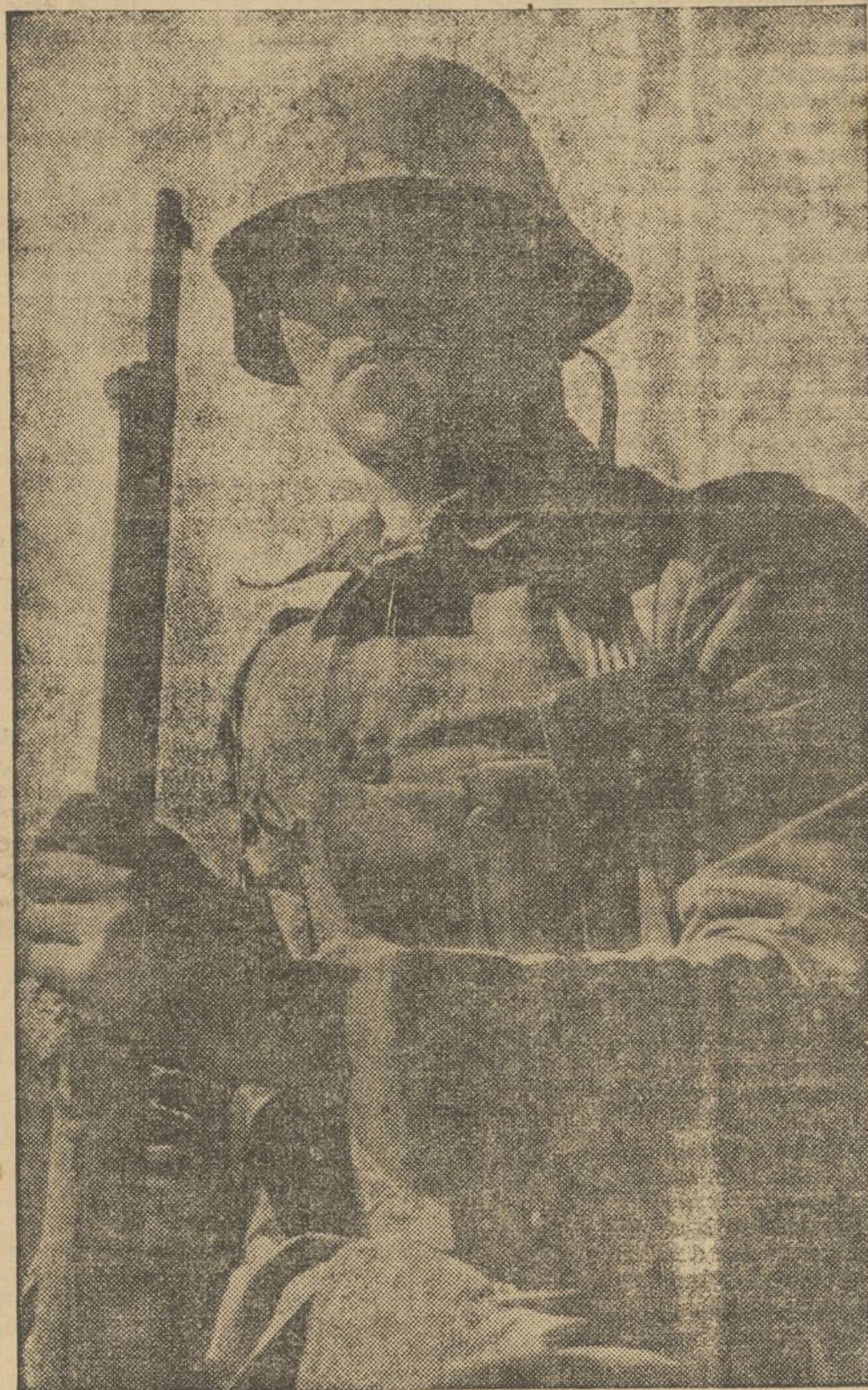
¡UN PASO ATRAS! EL SOLDADO REPUBLICANO, PERFECTAMENTE EQUIPADO Y DISCIPLINADO, NO TIENE OTRA CONSIGNA QUE CUMPLIR: ¡ADELANTE! ¡A POR LA LIBERTAD DE ESPAÑA!

Nuestros cañones castigaron duramente al enemigo en el Barrio de Usera, en Carabanchel, y sus posiciones del monte Garabitas, cuyas primeras líneas de trincheras fueron tomadas por las tropas leales. Han quedado estranguladas las comunicaciones de los facciosos en la Ciudad Universitaria. Heroica actuación de nuestros dinamiteros