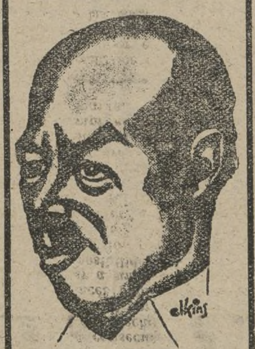
Van Zeeland, jefe del Gobierno belga y vencedor de las pasadas elecciones en Bruselas

Londres.—El Comité de No Intervención ha comunicado que las Islas Canarias, Ithi, Río de Oro, Río Muni y Fernando Poo