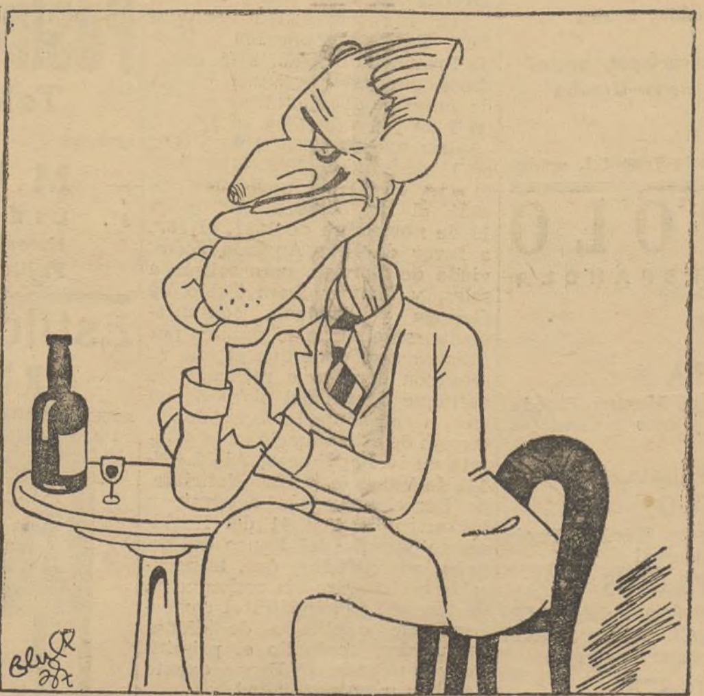
Este franco no tiene conciencia. ¡Con el trabajo que me ha costado robarlo!