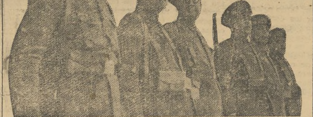
Nuestro aplauso entusiástico, sincero, sin regateos, al heroico Cuerpo de Carabineros.

Lealtad, disciplina, honor, dignidad, esto representa el Cuerpo de Carabineros. Sus componentes, gente aguerida, apegada a la lucha, especializada en la defensa de los intereses del Estado, desde los primeros momentos de la cobarde sublevación militar, pusieron a contribución su esfuerzo para colaborar en la lucha contra el fascismo. Pero si alguien tuviera la menor duda de aquella lealtad acrisolada, contrastada en muchas etapas y episodios de nuestra guerra, bastará decir que en los frentes de Guadalajara la actuación de la Columna de Carabineros ha sido tan brillante y heroica, que por sí sola coloca a estos bravos luchadores en la vanguardia de los mejores defensores de España, de la España auténtica, que es el pueblo.