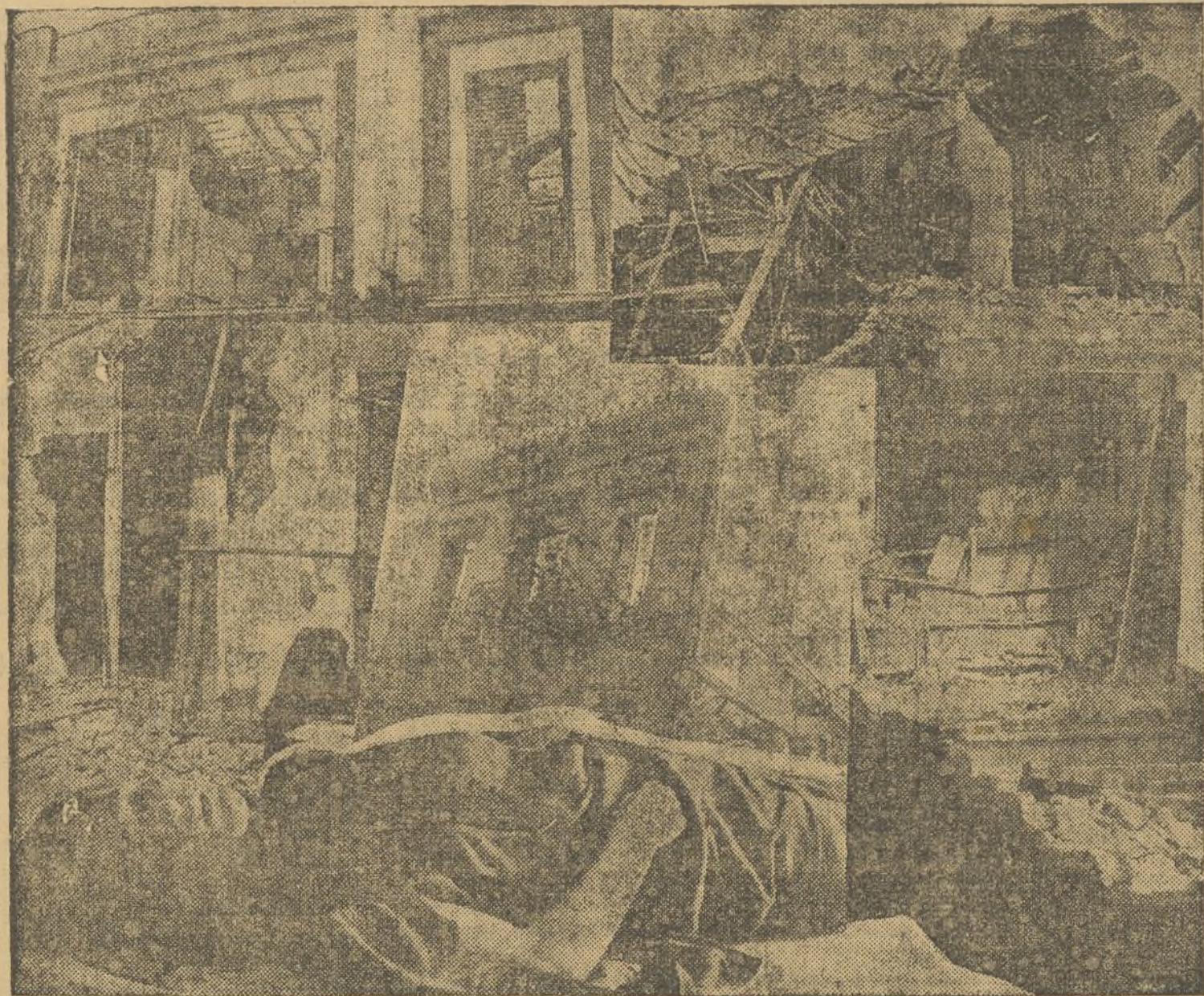
He aquí los objetivos "militares" del fascismo: escombros de lo que fueron hogares modestos, viviendas de trabajadores... Entre las ruinas, la carne de la "made in Germany" y "made in Italy"... Y que siga matando como se emplean los niños, a mujeres y de niños, a jirones, ¡Que el Control de No Intervención!

EN LA MAÑANA DE AYER, EL "CANARIAS" Y EL "BALEARES" ENFILARON SUS CAÑONES SOBRE LA COSTA LEVANTINA. NUESTRA CIUDAD RECIBIÓ LA LLUVIA DE METRALLA, QUE HIZO BLANCOS SOBRE LA POBLACIÓN CIVIL Y DESTRUYÓ HOGARES MODESTOS. EN AGUAS DEL MEDITERRANEO, LOS BUQUES QUE TIENEN LA MISIÓN DE "CONTROLAR", DE ACUERDO CON LOS COMPROMISOS DE LONDRES, SIGUIERON EJERCIENDO SUMISIÓN DE ATENTOS "VIGILANTES". DESDE LAS COSTAS DE LA ESPAÑA LEAL SE HIZO HUIR A LOS COBARDES AGRESORES, DISPARANDO LAS SALVAS AL GRITO DE ¡VIVA LA REPÚBLICA!