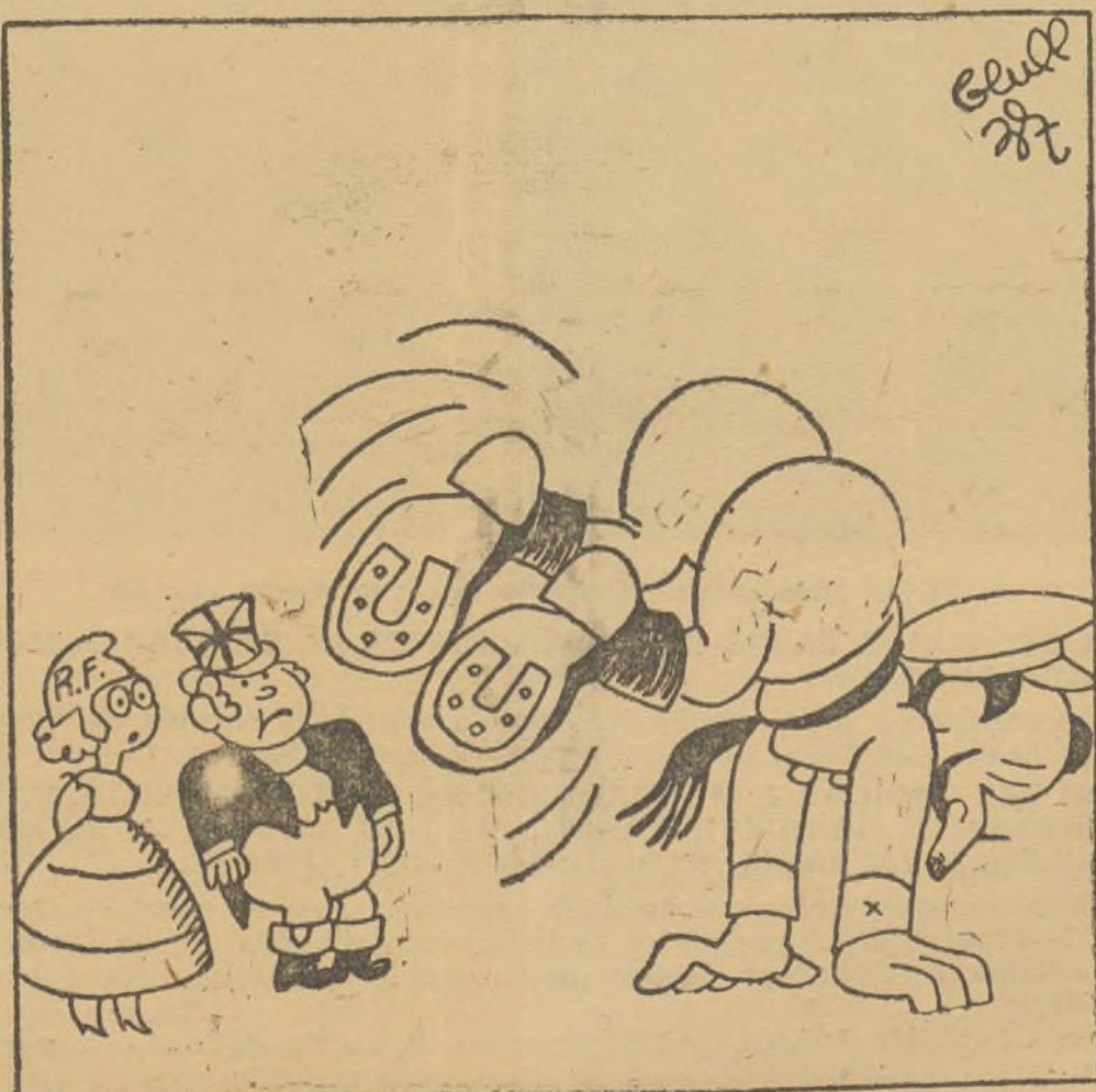
Queipo practica la diplomacia estilo «nacional»