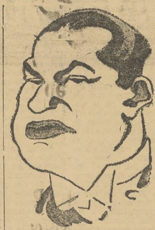
El conde Ciano, lugarteniente del duque y competente discipulo de su politica.

La idea de un compromiso en España no encuentra defensores en Italia, pero, lo que es más importante, tampoco encuentra adversarios. Parece que la posición de Italia es más prudente en la actualidad que lo era el mes pasado y todo hace creer que las entrevistas italo-alemanas han tenido por resultado que esta prudencia se acentúe todavía más.