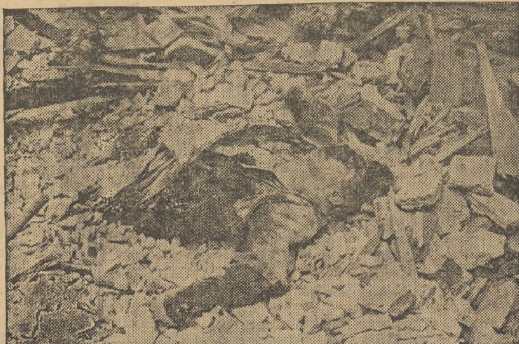
¡ESTA ES LA OBRA DEL FASCISMO!