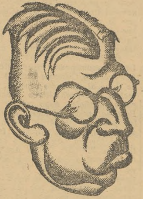
MISTER ANTHONI EDEN Ministro de Negocios Extranjeros de la Gran Bretaña

Dublin.—El general O'Duffy ha ordenado a la Brigada irlandesa