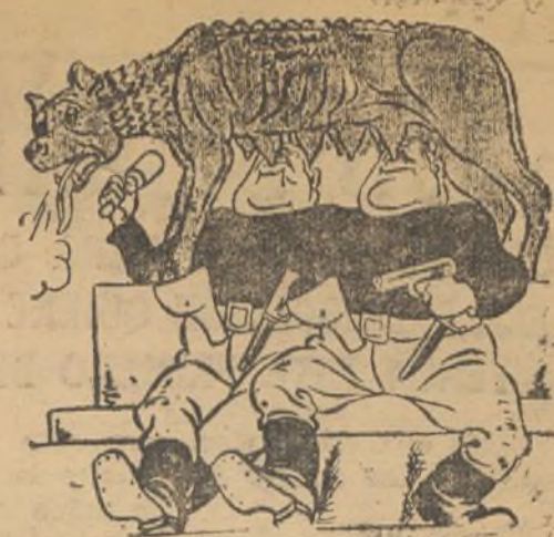
El Rómulo-Remo de hoy succiona la loba moderna del fascismo