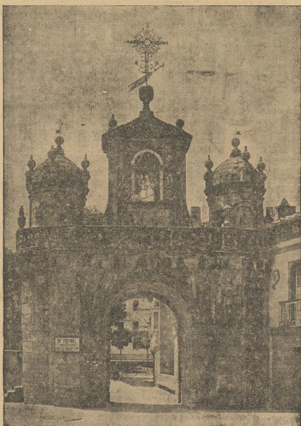
La Puerta de Santa María, en Durango. Hoy—después que la aviación negra ha pasado—sólo quedan unos escombros, donde pedazos de carne inocente se han soldado. Y el viejo musgo de los muros ha perdido su lozanía, su verdor clásico...