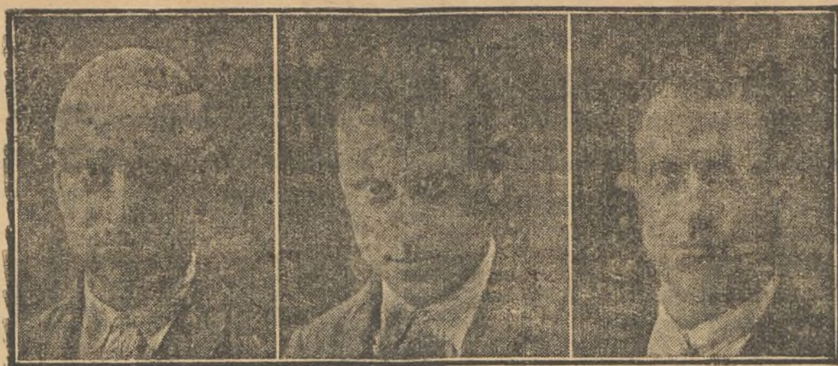
Doce años calvo.—Después de diez meses curado

Si no le sale el pelo en seis meses, el inventor abonará al paciente la cantidad de 5.000 pesetas, que previamente será depositada en el Banco de España.