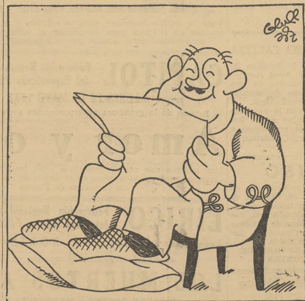
El de la «Quinta Columna».—¡Vaya, vamos a ver cuánto hemos prosperado hoy en la retaguardia republicana!