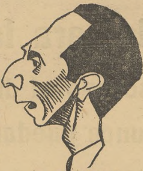
EL DR. GOEBBELS

Insistir una vez más sobre la ayuda abierta y descarada que el III Reich dispensa al ejército fascista de Franco, no supondrá ilustrar a los lectores del delito y de la violación del derecho internacional del fascismo ha tomado ya como cosa propia. Pero las noticias, que de los centros oficiales de Roma y de Berlín nos llegan, nos obligan a delatar una vez más los nuevos envíos de hombres y de material de guerra que, pese a los debates encubiertos de la Cámara de los Comunes, se están llevando a cabo sin el menor recato.