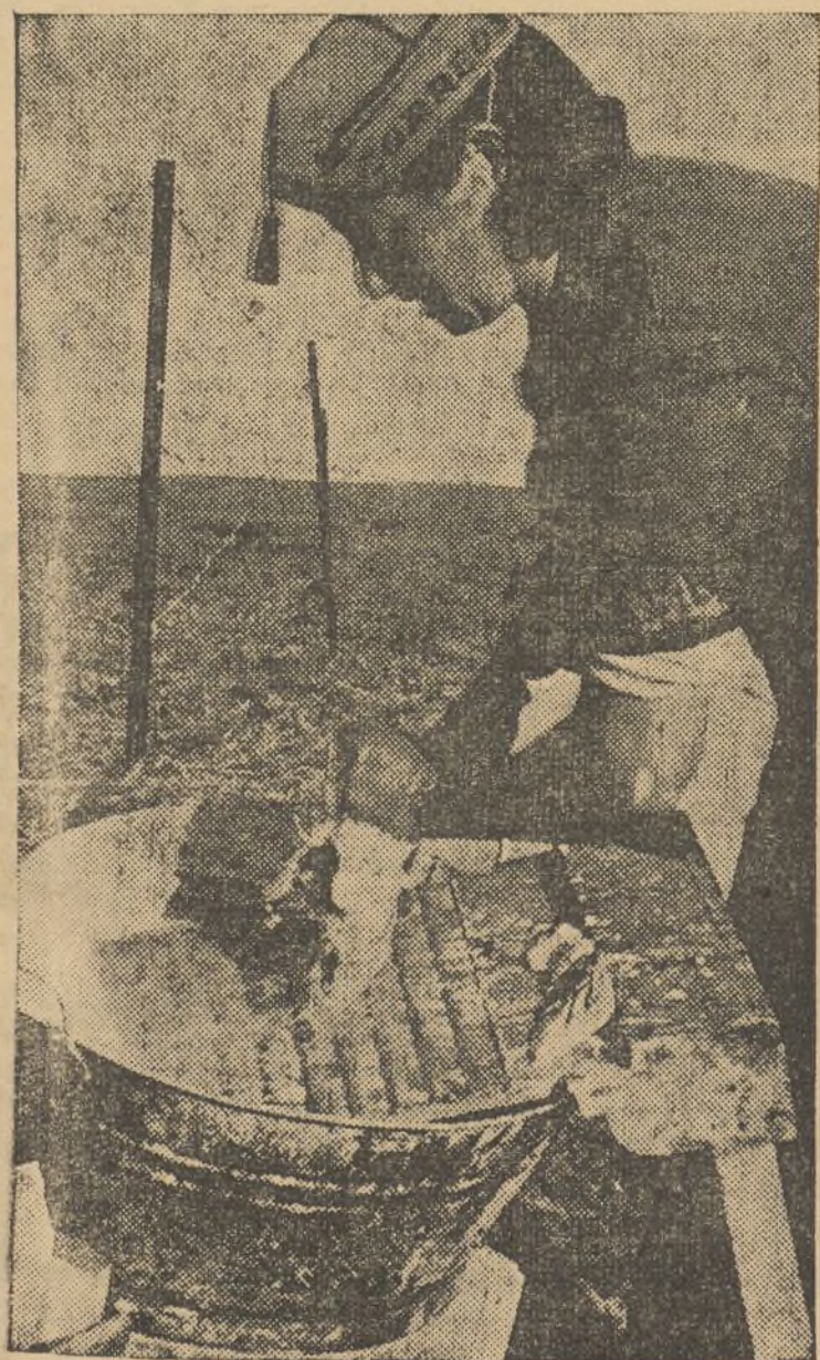
En los frentes, la camarada que atiende el servicio de Correos se dedica a lavar trapos sucios en un descanso de la labor diaria...