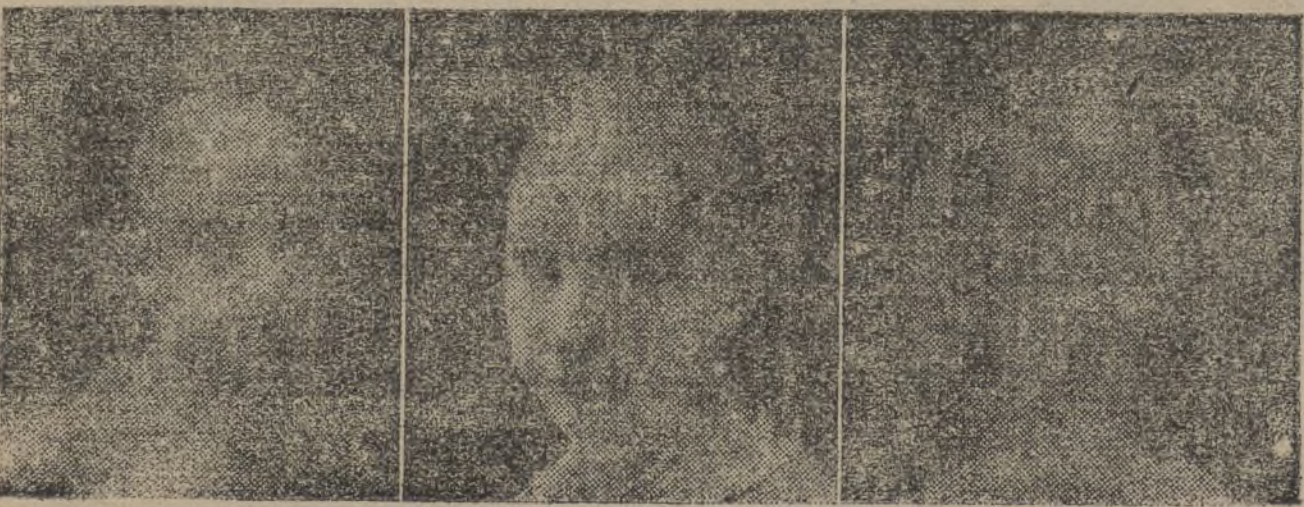
Valenciano, 12 años calvo y considerado incurable. El efecto del Capilar Mourade después de 3 meses