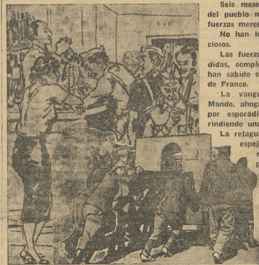
Seis meses de lucha, de resistencia heroica del pueblo madrileño ante la avalancha de las fuerzas mercenarias.

No han logrado su criminal intento los fasciosos.