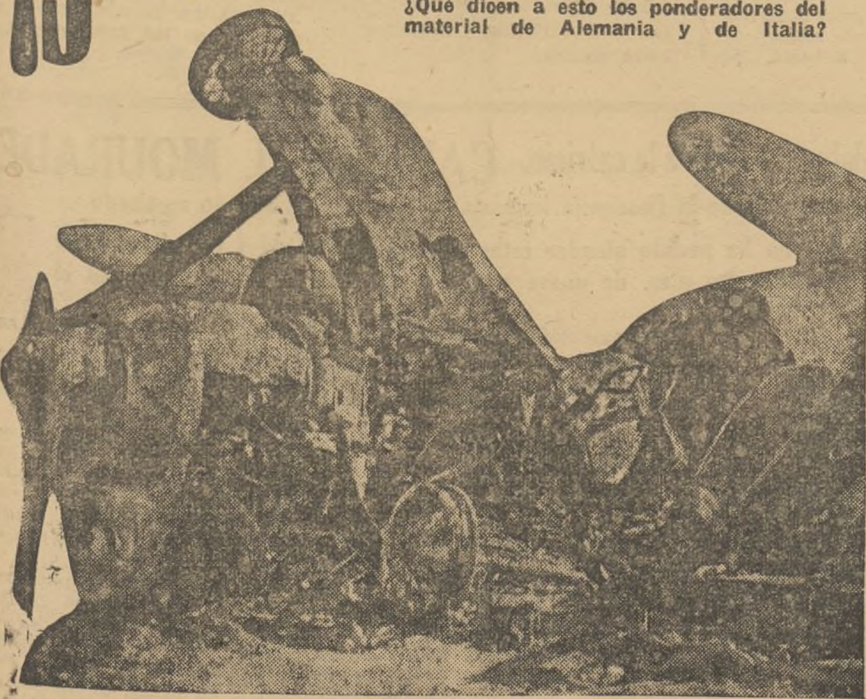
Dos aparatos destruidos: uno fabricado en Italia y otro en Alemania. Simbolismo del fascismo convertido en chatarra.

¿Qué dicen a esto los ponderadores del material de Alemania y de Italia?