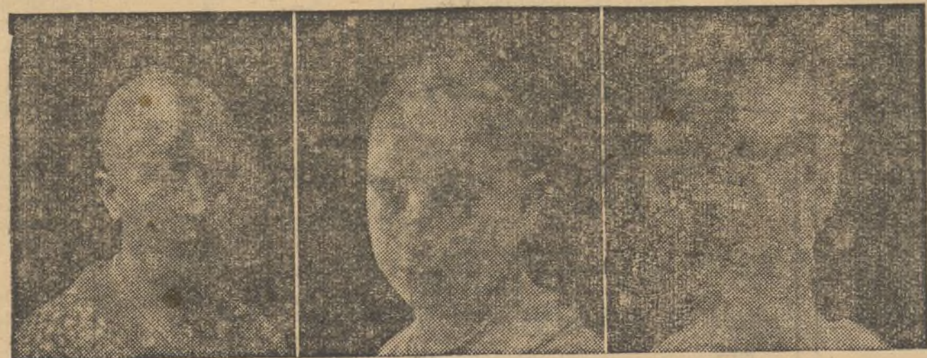
Valenciano, 12 años calvo y conserguencia incurable. En efecto del Capilar Mourade después de 3 meses