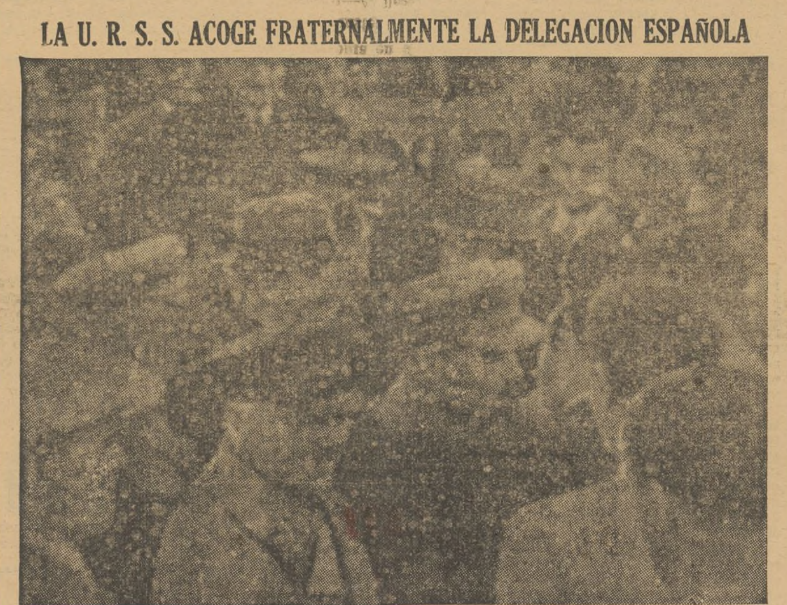
Con motivo de las fiestas de Mayo, la Delegación española asistió al desfile monumental en Moscú. El jefe del Gobierno soviético, camarada Stalin, abrazó a nuestros compañeros en medio de la expectación popular.