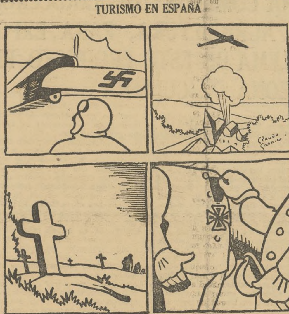
HISTORIETA SIN PALABRAS

TODOS LOS SABADOS, POR LA TARDE, de cinco a siete horas, están abiertas sus oficinas al público para realizar operaciones en LIBRETA POPULAR DE PEQUEÑO AHORRO.