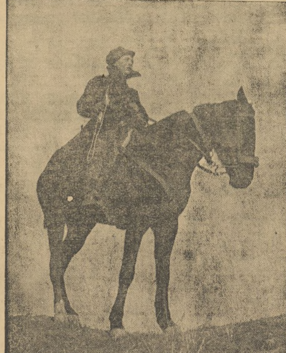
Sobre la cúspide del monte, el soldado de la República vigila los movimientos del enemigo