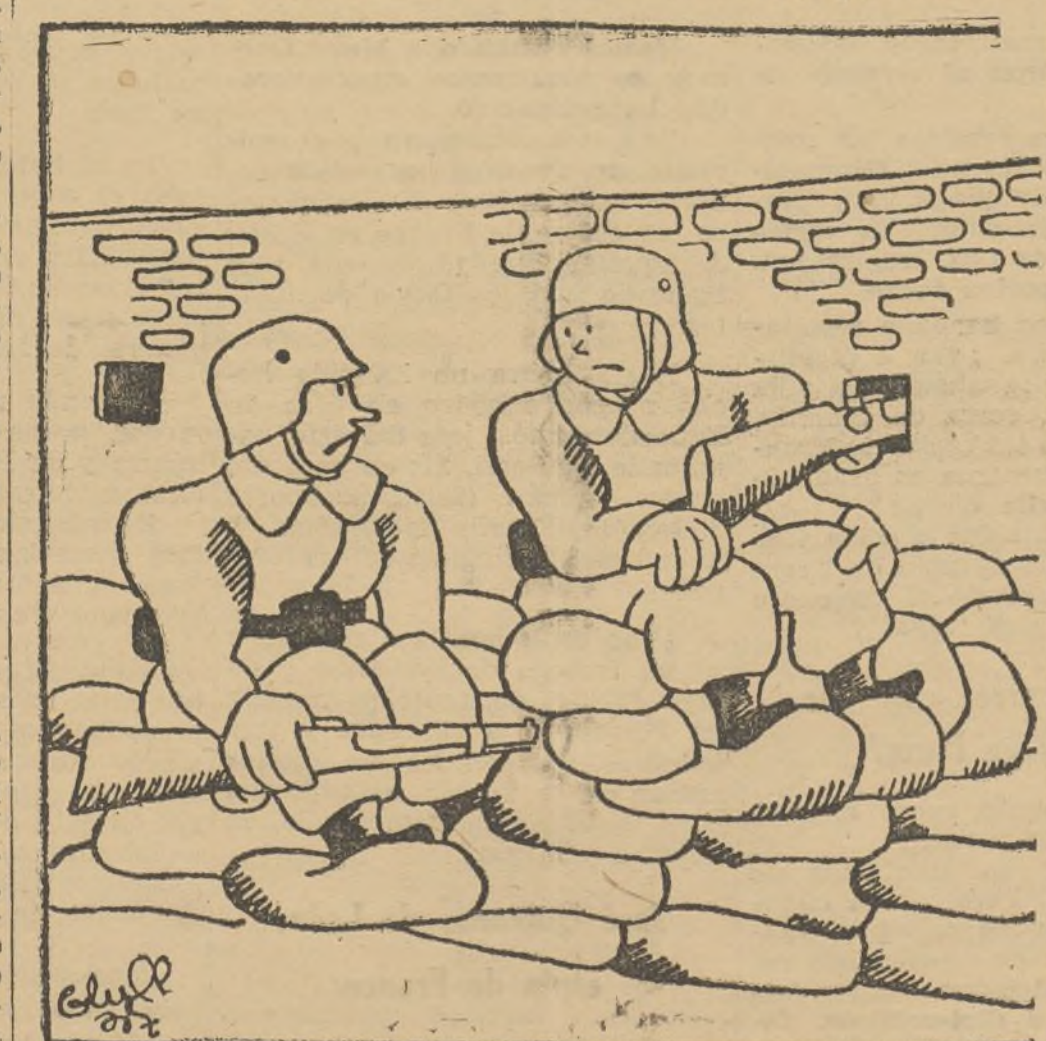
—Dicen que las distintas ideologías... —¿Las distintas ideologías? ¿Y eso qué es?