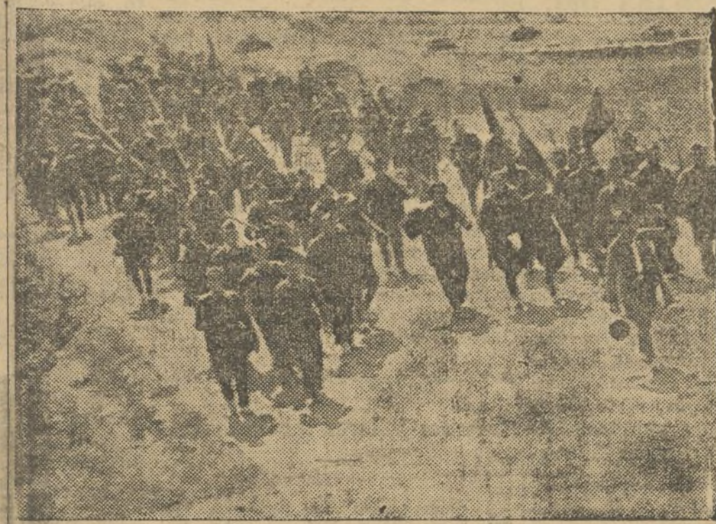
Carretera adelante, los soldados del pueblo avanzan cara a la lucha contra los invasores de la España republicana

La atmósfera del campo fascista—nos dicen cuantos lo-