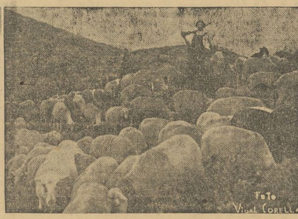
A veces llegan, mezcladas entre las noticias guerreras, algunas hazañas de nuestros soldados. He aquí el producto de un golpe afortunado dado por un grupo de valientes soldados, que, adentrados en el campo enemigo, han conseguido capturar a los fasciosos un considerable número de carneros.