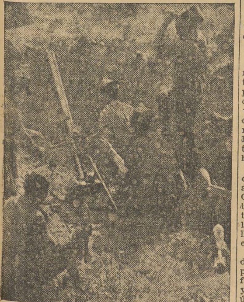
Un mortero en las trincheras del Ejército del pueblo. Tras él, nuestros soldados, puestos los ojos ante el enemigo, espiando sus menores movimientos, defendiendo la independencia y la libertad de nuestra Patria.

—¡Infame! ¡Cómo abusas de una débil mujer!