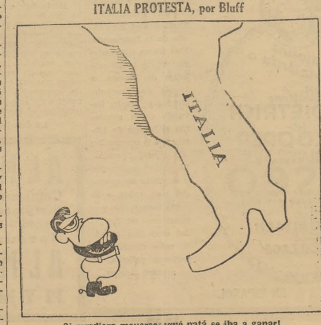
Si pudiera moverse, ¿qué patá se iba a ganar!

Con motivo de la proyección del film «Valencia, en la retaguardia», y al aparecer en ella Caballero en el balcón del palacio presidencial, durante la grandiosa manifestación del 14 de febrero, el público prorrumpió en atronadores aplausos y vivas al ex Presidente del Consejo de ministros.