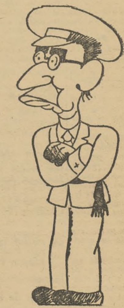
LA NOTICIA EN BERLIN

Además del general Mola se encontraban a bordo del avión dos de sus oficiales, el piloto, el mecánico y un asistente.