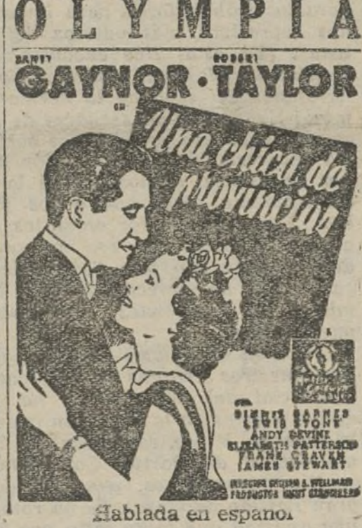
Habla en español.

taban, idiotamente, de que se alarmara a la gente sin motivo.