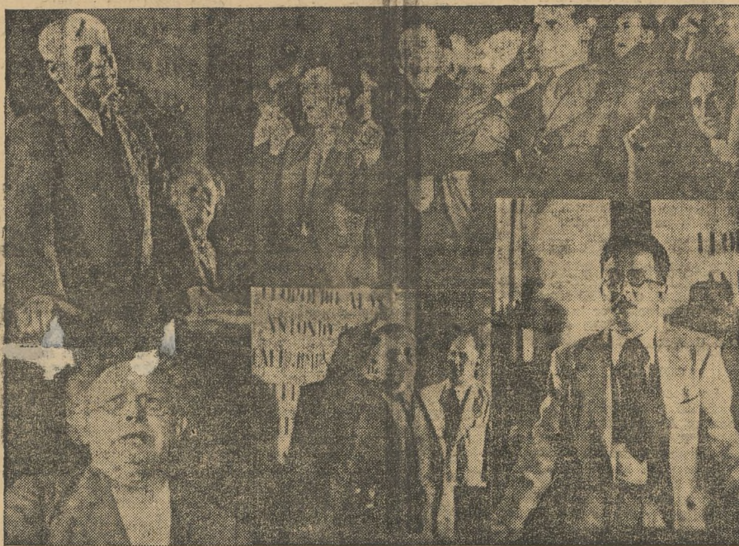
Varios aspectos de la Asamblea inaugural de las sesiones de Valencia (Información en quinta página)