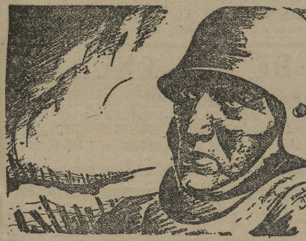
UN ADMIRABLE ESFUERZO