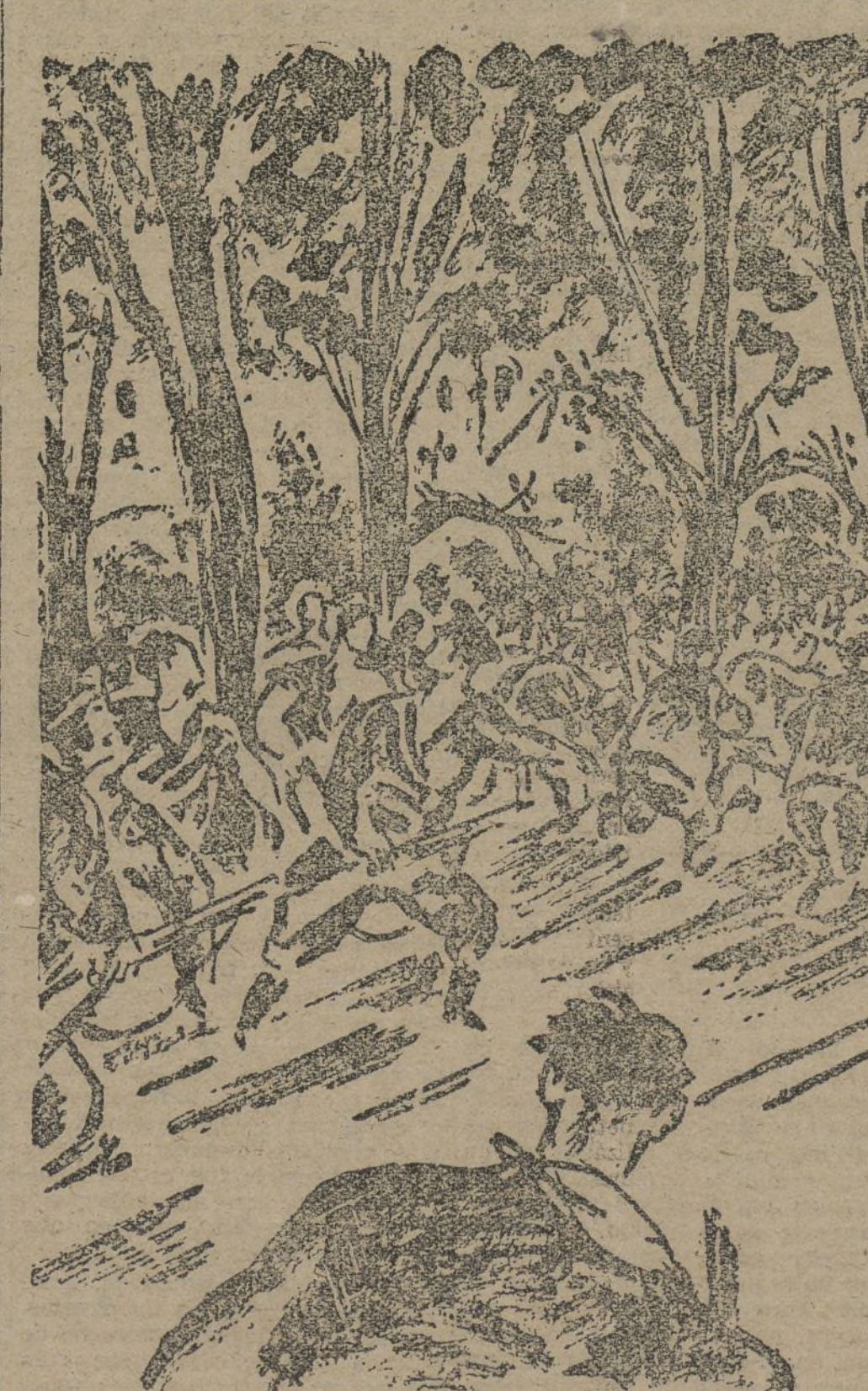
Evocación del momento en que las masas se lanzan, en avalancha, al asalto de la puerta principal del cuartel de la Montaña

Vidal, de Artillería, que inmediatamente empezó los trabajos para el emplazamiento de tres piezas en la plaza de España. Poco después se les cortó la luz a los sublevados y acto seguido, desde la terraza del número 2 de la calle de Ferraz, con un potente altavoz, dirigieron la palabra invitándoles a deponer su actitud para evitar