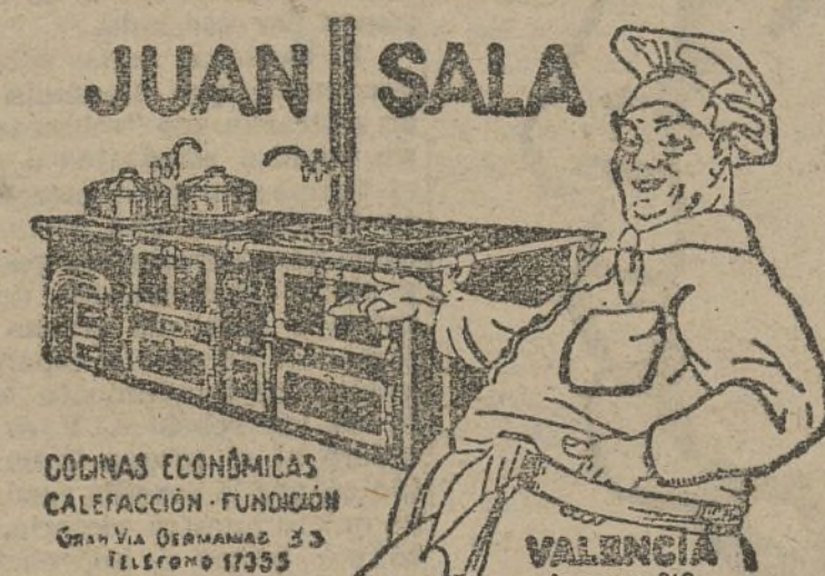
COCINAS ECONOMICAS CALEFACCION-FUNDICION Gran Via Orlao 23 Teléfono 17355

Venta al detall y por mayor: Adresadors, 2, entresuelo